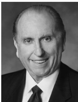
Από τον Πρόεδρο Τόμας Μόνσον