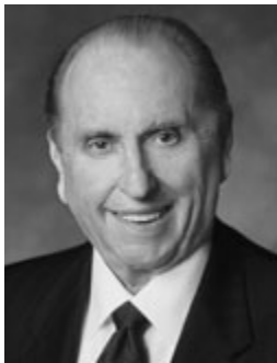
Από τον Πρόεδρο Τόμας Μόνσον