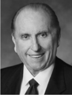
პრეზიდენტი თომას ს. მონსონის მიერ