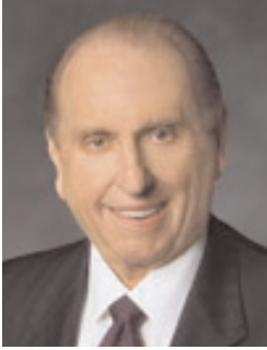
პრეზიდენტი თომას ს. მონსონი