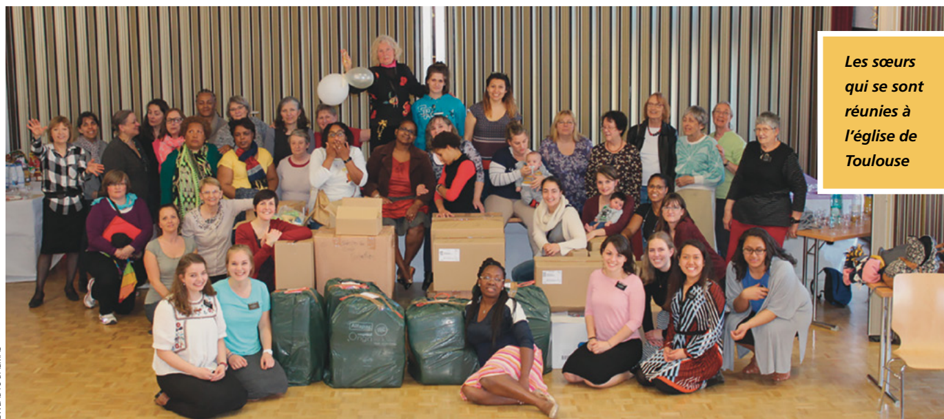
Les sœurs qui se sont réunies à l'église de Toulouse

Un copieux buffet a assuré la transition vers un atelier pratique sur