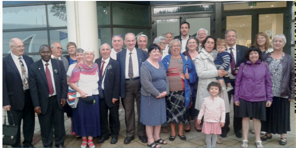
Les missionnaires de la mission francophone de service de soutien de FamilySearch