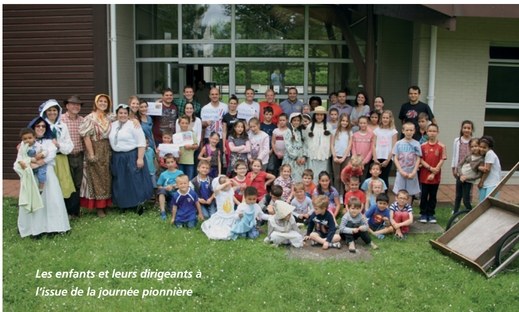
Les enfants et leurs dirigeants à l'issue de la journée pionnière

Et pour terminer en beauté cette après-midi aussi instructive que récréative, tout le monde a été invité à déguster de bons cookies faits maison et selon les recettes de l'époque ! ■