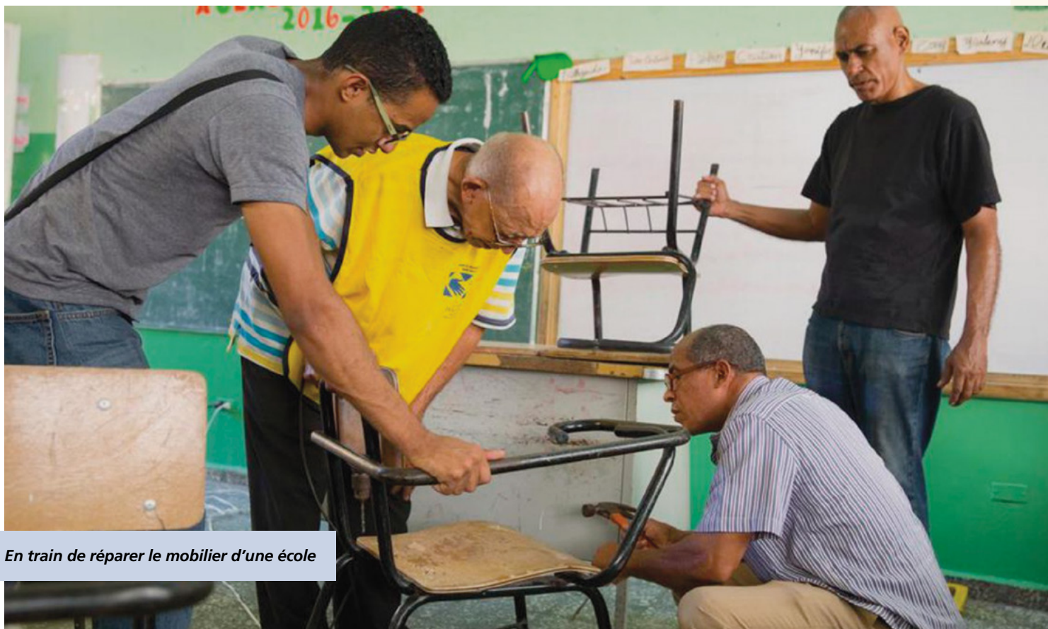
En train de réparer le mobilier d'une école

« La journée internationale du Service est un évènement de solidarité et de volontariat de L'Église de Jésus-Christ des Saint des Derniers Jours, en collaboration avec d'autre organisations religieuses, mairies, Police Nationale, les organisations de quartier, avec entre autre, parmi les entités gouvernementales, le ministère de la sante public, de manière à rassembler les efforts pour développer des activités de service aux