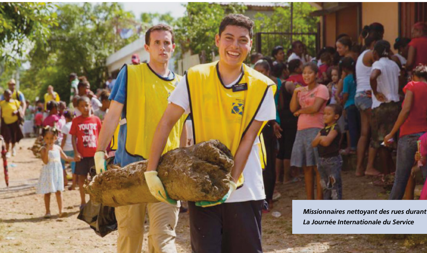
Missionnaires nettoyant des rues durant La Journée Internationale du Service