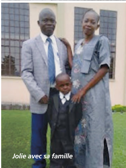
Jolie avec sa famille