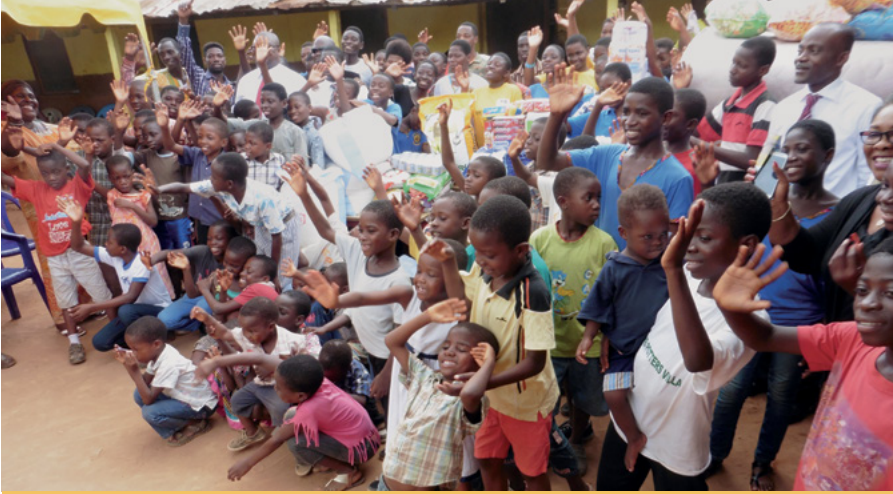
Les élèves du Village Potter démontrent leur reconnaissance.