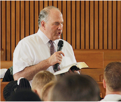
Ronald A. Rasband du Collège des douze apôtres donne des conseils, le 14 mars 2016, aux missionnaires qui servent aux missions de Ghana Accra et de Ghana Accra Ouest.