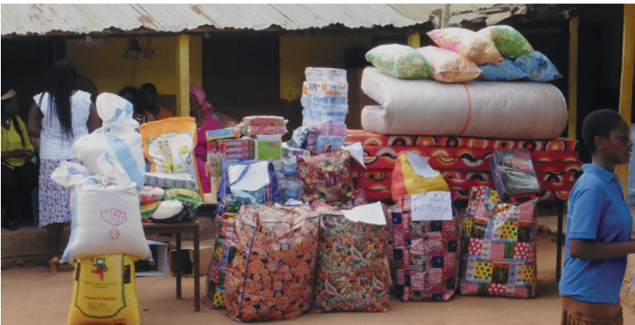
Les dons faits au Village Potter par le pieu d'Adenta de l'Église de Jésus-Christ des Saints des Derniers Jours.