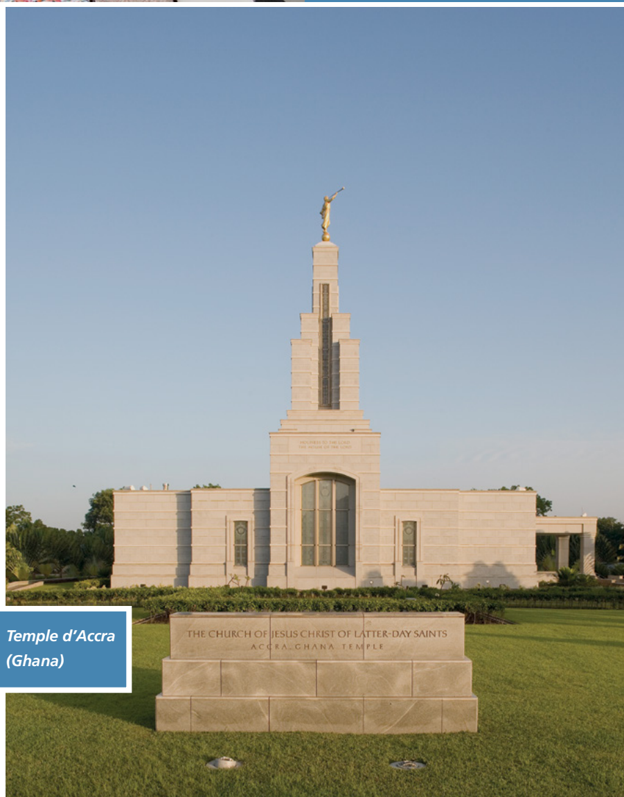
Temple d'Accra (Ghana)