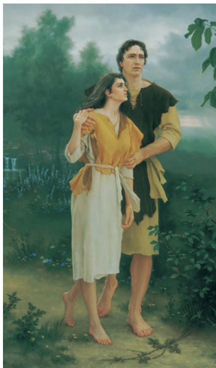
LEAVING THE GARDEN, PAR JOSEPH BRUCKEY

Nous faisons des alliances avec Dieu dans nos temples pour montrer notre désir de vivre avec lui éternellement. Nous ne pouvons pas le faire à moins de connaître l'importance du rétablissement de la prêtrise dans notre dispensation. « Vous, au contraire, vous êtes une race élue, un sacerdoce royal, une nation sainte, un peuple acquis, afin que vous