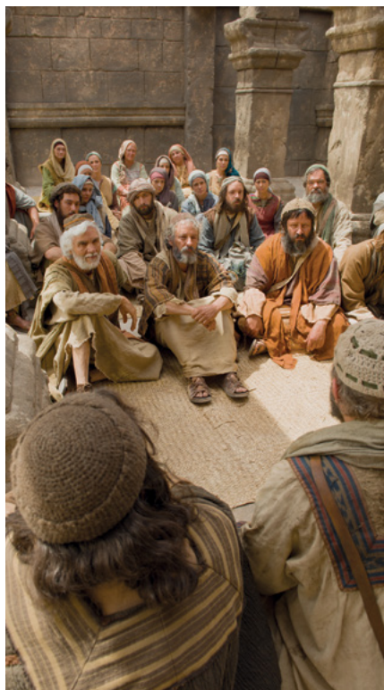
DE LA LETTRE DE PAUL AUX EPHÉSIENS : « L'UNITÉ DE LA FOI » TITRE DE VIDÉO DE LA BIBLIE SUR LDS.ORG

Sous la direction de Pierre, l'apôtre dirigeant et prophète, l'Église dans les temps anciens a grandi et prospéré. Lui et les autres apôtres et prophètes ont enseigné l'Évangile avec autorité et puissance d'une manière que seuls des apôtres pouvaient le faire. (Voir, par exemple, Actes 2:14-47 ; Actes 3 et Actes 13-14). Ils ont apporté des solutions aux disputes et aux préoccupations dans l'Église. (Voir, par exemple, Actes 15). Tous ont été bénis par la direction des apôtres et des prophètes.