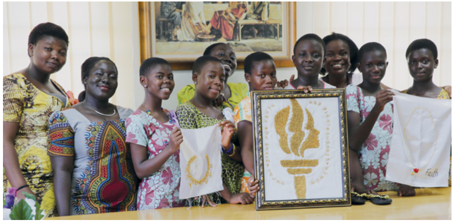
Les Jeunes filles de la paroisse de Madina 1 et leurs dirigeantes

Àu début de l'année 2015, les jeunes filles de la paroisse de Madina 1 du pieu d'Adenta (Accra, Ghana) ont décidé d'avoir un projet spécial de « Mon Progrès Personnel ». Elles avaient connu un certain succès