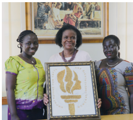
La présidence des jeunes filles de la paroisse de Madina 1

Nous aimons le Seigneur et nous sommes reconnaissantes d'avoir eu l'opportunité d'apprendre de nouvelles choses pendant que nous essayons de nous lever et briller à toutes les générations. Les programmes de l'Église nous donnent le désir de découvrir et de partager nos talents et nous sommes reconnaissantes de l'opportunité de faire partie du royaume du Seigneur dans cette partie du monde. ■