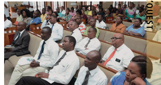
Une partie des participants

Les participants ont apprécié l'interaction en profondeur avec les animateurs qui étaient des entrepreneurs pendant les différentes séances. ■