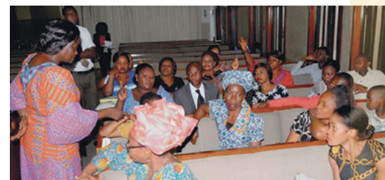
Des participants à une séance d'échanges