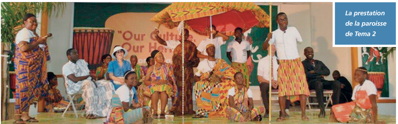
La prestation de la paroisse de Tema 2

Le thème pour le programme « NOTRE CULTURE, NOTRE PATRIMOINE – A LA MANIÈRE DU SEIGNEUR » sert à renforcer les meilleures parties de notre culture et traditions par la véracité de l'Évangile rétabli fusionnant ainsi le meilleur des deux facteurs qui forment nos idéaux et nos modes de vie.