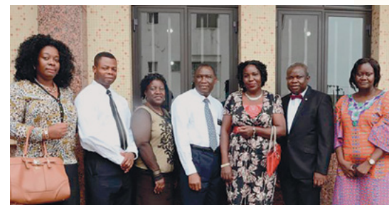
Les dirigeants de l'Église et les consultants