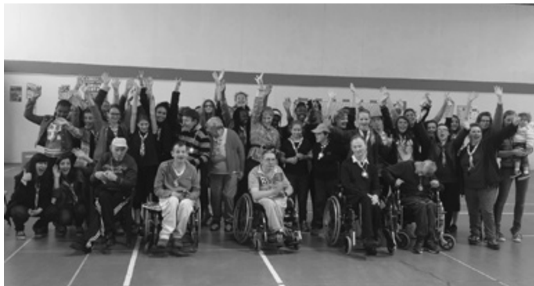
Les jeunes filles du pieu de Rennes en compagnie des personnes handicapées

attitude positive, courtoise et aimable, elles ont fait de ce camp un lieu saint où il a fait bon vivre et où l'Esprit Saint était présent à chaque instant.