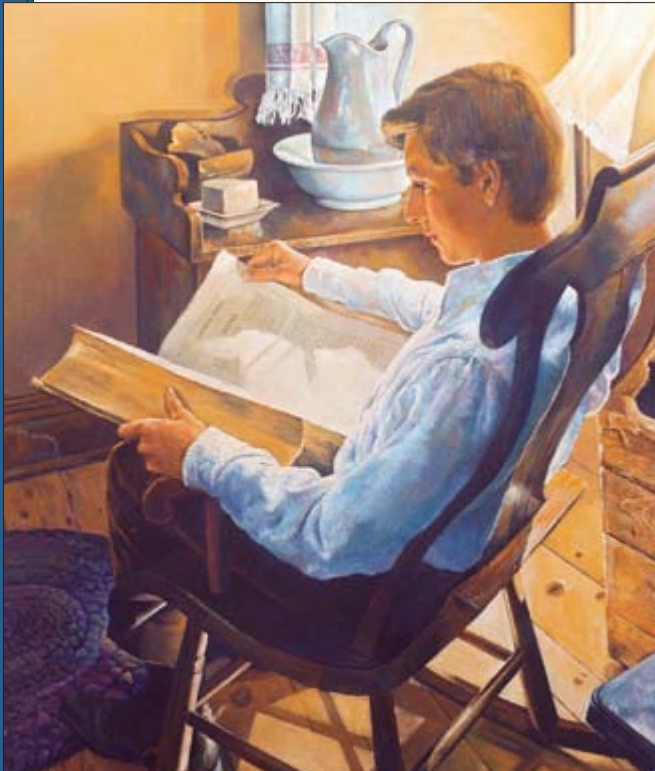
Josephin pohtiessa, mihin kirkkoon hänen tulisi liittyä, hän etsi Raamatusta johdatusta. Siitä hän luki: Pyydä Jumalalta.

Tuosta päivästä lähtien Joseph ahkeroi Jumalan palveluksessa tehden työtä Myöhempien Aikojen Pyhien Jeesuksen Kristuksen Kirkon palauttamiseksi ja Jumalan valtakunnan rakentamiseksi maan päälle näinä myöhempinä aikoina. Kirkon uskolliset jäsenet todistavat, että Jeesus Kristus on maailman Vapahtaja ja Lunastaja. Jeesus