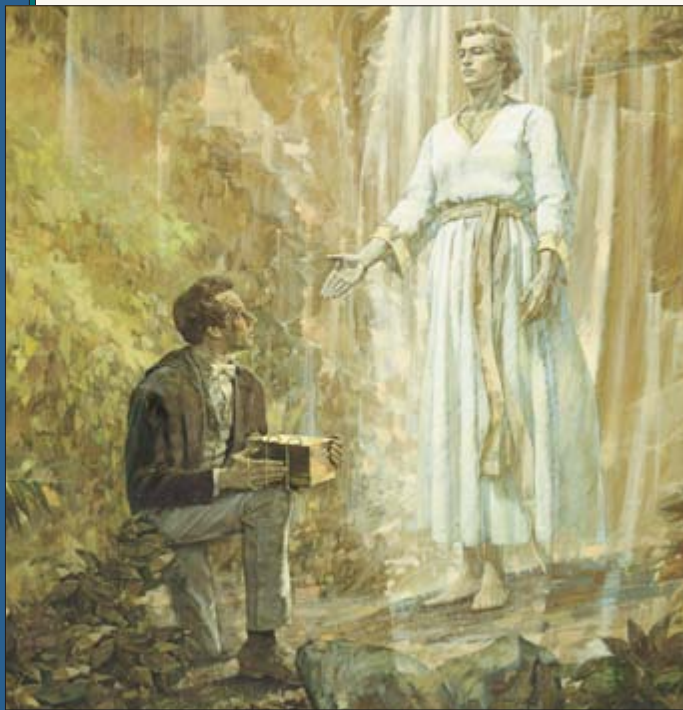
Moroni palasi neljä kertaa vuoden välein ja antoi lisää ohjeita nuorelle profeetalle. Noiden neljän vuoden jälkeen Joseph sai levyt ja ryhtyi kääntämään Mormonin kirjaa.

Tämän kolmannen käynnin jälkeen hän nousi jälleen taivaaseen kuten ennenkin, ja