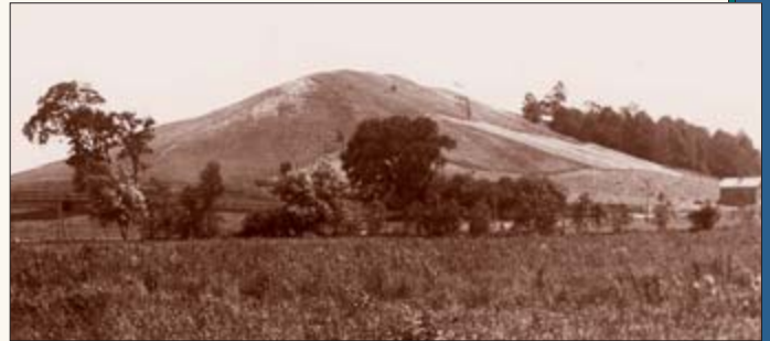
Kumoran kukkula sijaitsee noin viisi kilometriä kaakkoon Smithien tilasta Palmyrassa New Yorkin osavaltiossa. Josephin aikoina kukkulan pohjoispäähän peitti ruoho ja etelässä kasvoi siellä täällä kookkaita puita sekä metsikköä. Levyt oli haudattu kukkulan länsipuolelle lähelle sen lakea. Valokuva: elokuu 1907.

H än aloitti ja kertoi uudestaan aivan samat asiat kuin ensimmäisellä käynnillään, ilman vähäisintäkään poikkeamaa; sen tehtyään hän ilmoitti minulle suurista tuomioista, jotka kohtaisivat maata nälänhädän, miekan ja ruttotaudin suurien hävitysten myötä, ja että nämä ankarat tuomiot kohtaisivat maata tämän sukupolven aikana. Nämä