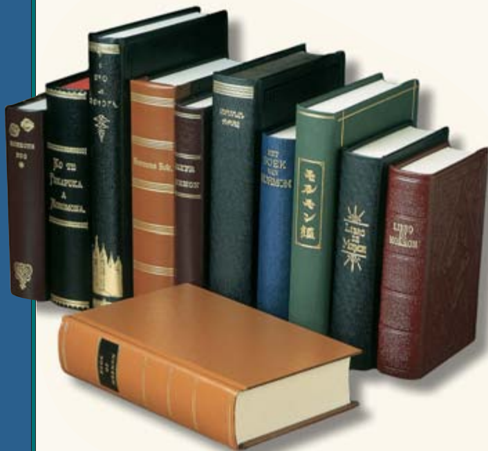
Vuonna 1830 ensi kerran painettu Mormonin kirja on nykyisin julkaistu yli 80 kielellä eri puolilla maailmaa.

Luonamme tällöin käynyt ja pappeuden meille antanut sanansaattaja sanoi, että hänen nimensä oli Johannes, sama, jota kutsutaan Johannes Kastajaksi Uudessa testamentissa, ja että hän toimi Pietarin, Jaakobin ja Johanneksen käskystä, joilla oli hallussaan Melkisedekin pappeuden avaimet, mikä pappeus, hän sanoi, suotaisiin aikanaan meille, ja että minua tuli kutsua kirkon ensimmäiseksi vanhimmaksi ja häntä (Oliver Cowderya) toiseksi. Asettamisemme tämän sanansaattajan käden alla ja kastamisemme tapahtuivat toukuun viidentenätoista päivänä 1829.