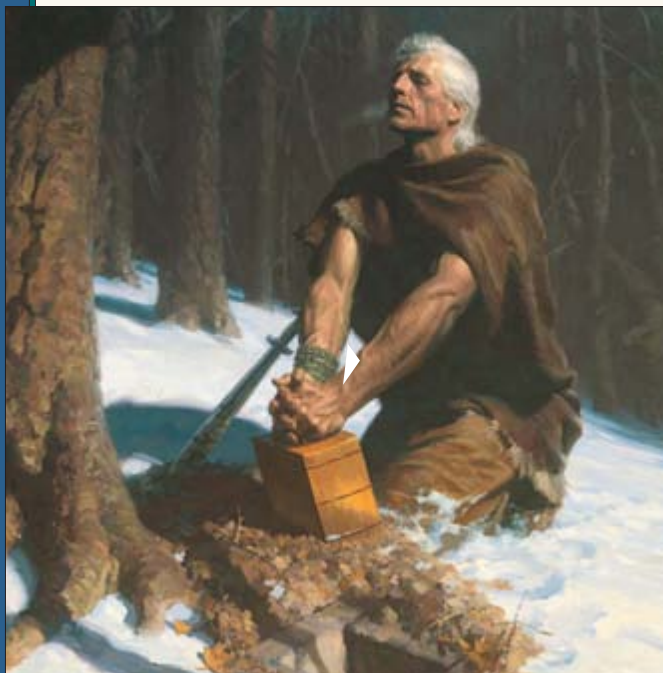
Profeetta Moroni oli haudannut kansansa pyhät aikakirjat Kumoran kukkulaan vuonna 421 jKr. Myöhemmin hän palasi ylösnousseena olentona kertomaan Joseph Smithille muinaisesta aikakirjasta, joka sisältää evankeliumin täyteen sellaisena kuin Vapahtaja opetti sen Amerikan mantereen muinaisille asukkaille. Tämä aikakirja on Mormonin kirja.

H än sanoi, että oli olemassa talteen pantu kirja, kultalevyihin kirjoitettu, joka kertoi tämän mantereen muinaisista asukkaista ja mistä he olivat lähtöisin. Hän sanoi myös, että siihen sisältyi ikuisen evankeliumin täyteys sellaisena kuin Vapahtaja antoi sen muinaisille asukkaille;