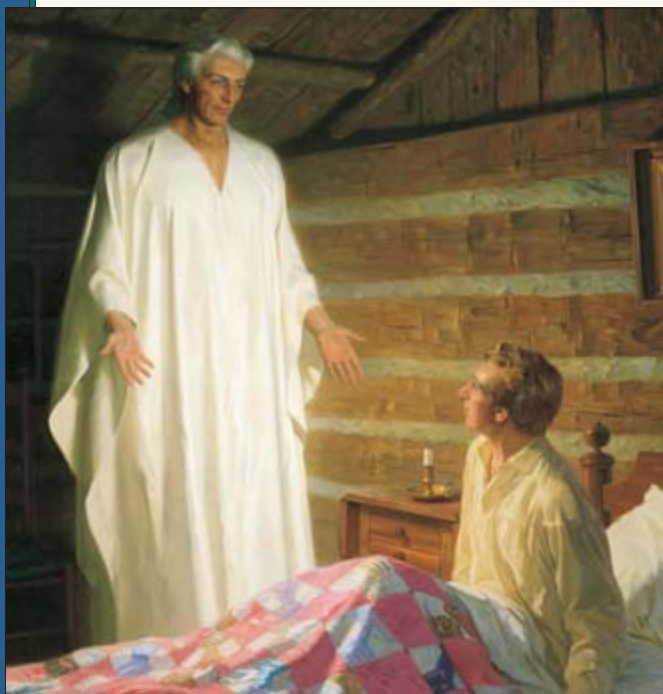
Kolme vuotta Joseph Smithin ensimmäisen näyn jälkeen Jumala lähetti enkeli Moronin kertomaan Josephille Jeesuksen Kristuksen evankeliumin palauttamisesta.

Vainot jatkuivat, kun Joseph kieltäytyi kiistämästä sitä, että hän oli nähnyt Jumalan. Käytyään vuoteeseen 21. syyskuuta 1823 Joseph rukoili