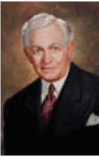
David O. McKay