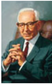
Joseph Fielding Smith