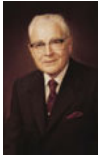
Harold B. Lee