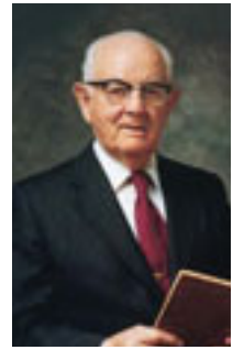
Spencer W. Kimball