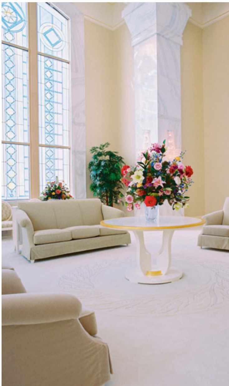
Selestiline ruum Columbia Riveri templis Washingtoni osariigis