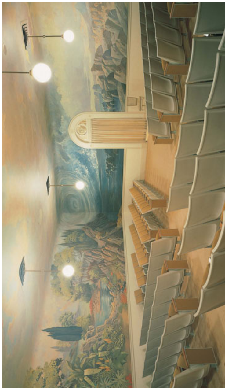
Loomise ruum Soolajärve templis