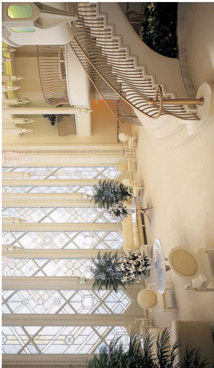
Selestiline ruum San Diego templis Kalifornia osariigis