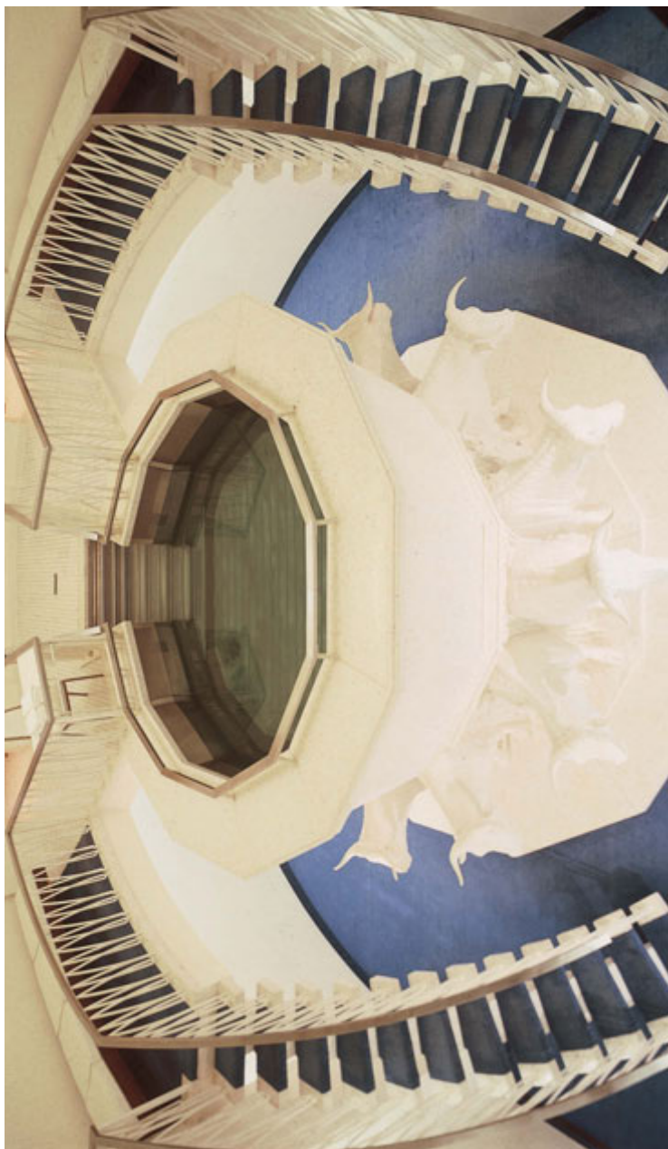
Ristimisein Washingtoni templis