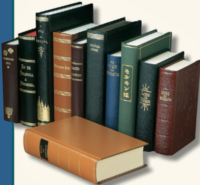
Mormoni Raamatut, mis trükiti esimest korda 1830. aastal, on praegu antud välja üle maailma rohkem kui 80 keeles.

Et saada täielikumat ülevaadet Joseph Smithi loost, vaata “Joseph Smith – Ajalugu” Kallihinnalises Pärlis või History of the Church, 1. kd, lk-d 2–79.