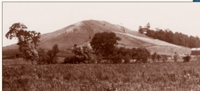
Kumoori künkas asub umbes viie kilomeetri kaugusel kagus Smithide talust Palmyras New Yorgi osariigis USAs. Josephi ajal oli selle põhjapoolne külg kaetud rohuga, lõunapoolne aga üksikute puude ning metsaga. Plaadid olid peidetud läänepoolsele küljele, mitte kaugele tipust. Foto: august 1907

aga mu üllatus, kui märkasin seda sama sõnumitoojat taas enda voodi kõrval seismas ja kuulsin teda mulle kordamas või üle rääkimas kõike seda, mida ta oli rääkinud ennegi; ning ta lisas hoiatuse, öeldes mulle, et Saatan võib üritada (kasutades ära minu isa perekonna vaesust) viia mind kiusatusse võtta need plaadid rikastumise eesmärgil. Ta keelas mul seda teha, öeldes, et mul ei tohi nende plaatide saamiseks olla muud ajendit kui Jumala austamine ja mul ei tohi olla ühtki teist eesmärki peale tema kuningriigi ehitamise, vastasel juhul ma neid ei saa.