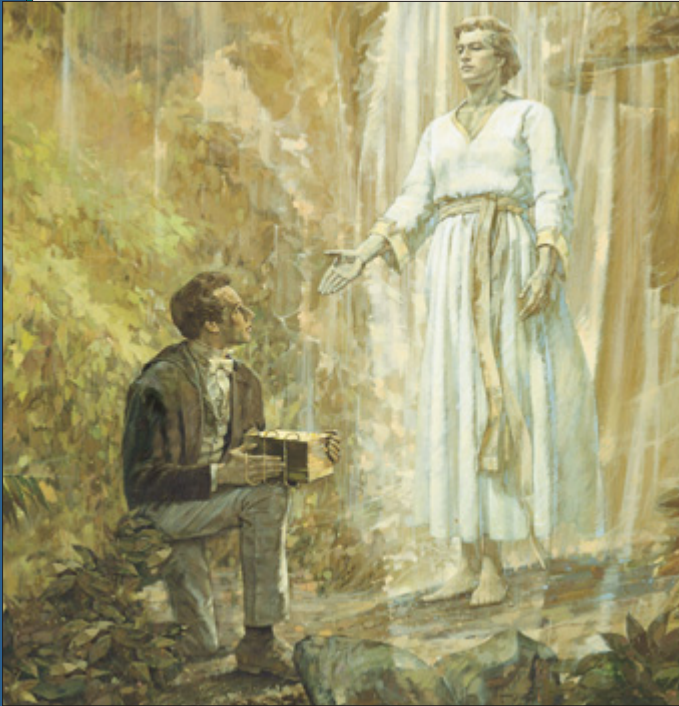
Moroni tuli nelja aasta jooksul igal aastal ühel korral ja andis noorele prohvetile uusi juhiseid. Pärast neid nelja aastat sai Joseph plaadid kätte ja hakkas tõlkima Mormoni Raamatut.

et minuga on midagi korrast ära ja käskis mul koju minna. Ma hakkasin maja poole minema, kuid üritades ronida üle põldu piirava aia, rauges mu jõud täiesti ja ma langesin abituna maha ning olin mõnda aega täiesti oimetu.