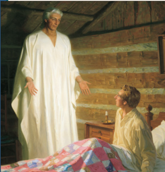
Kolm aastat pärast Joseph Smithi esimest nägemust saatis Jumal ingli nimega Moroni teda juhutama, et taastada Jeesuse Kristuse evangeelium.

Juba varem mainitud 21. septembri õhtul pärast voodisse minekut hakkasin palvetama ja paluma Kõikvõimsalt Jumalalt andestust kõikidele mu pattudele ja mõtlematutele tegudele, ja samuti palusin endale ilmutust, et võiksin teada oma kohta ja seisust tema ees, sest ma olin täiesti kindel taevaliku ilmutuse saamises, kuna olin juba varem sellise saanud.