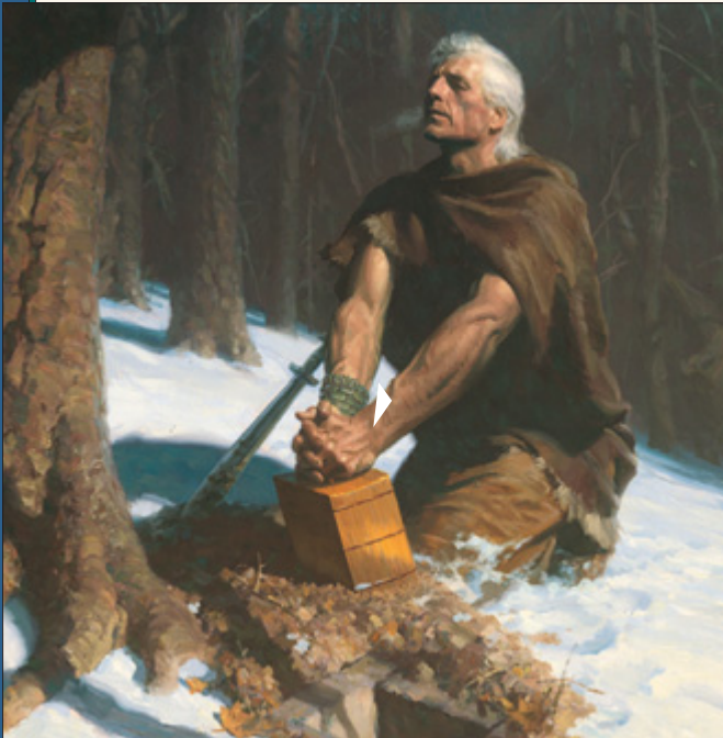
Aastal 421 pKr mattis prohvet Moroni oma rahva pühad ülestähendused Kumoora künkale. Ilmudes seekord ülestõusnud olendina, rääkis ta Joseph Smithile iidsetest ülestähendustest, mis sisaldavad evangeeliumi täiust, nii nagu Päästja selle Ameerika mandri muistsetele asukatele andis. Need ülestähendused kannavad nime: Mormoni Raamat.

P ärast nende asjade rääkimist hakkas ta tsiteerima Vana Testamendi prohvetlikke kuulutusi. Kõigepealt tsiteeris ta osa Malakia kolmandast peatükist ja edasi sama prohvetliku kuulutuse lõppu, kuid ta tegi seda meie Piibli sõnastusest pisut erinevalt. Selle asemel, et lausuda üheksateistkümnendat salmi nii, nagu see on meie raamatutes, ütles ta seda nõnda: