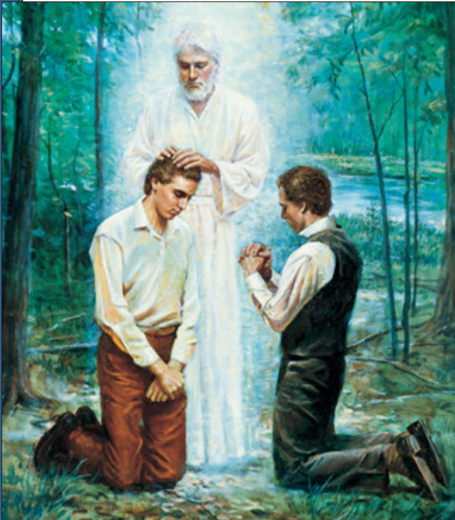
Joseph Smith ja Oliver Cowdery said Aaroni Preesterluse käte peale panemise läbi Ristija Johanneselt 15. mail 1829.

“Teile, minu kaasteenijad, annan ma Messia nimel Aaroni Preesterluse, mis sisaldab inglite teenimise ja meeleparanduse