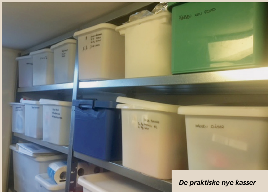
De praktiske nye kasser

Jeg har nu købt plastikkasser med låg i Ikea. Alt mit forråd er nu nemt at overskue, og det er let at tørre kasserne