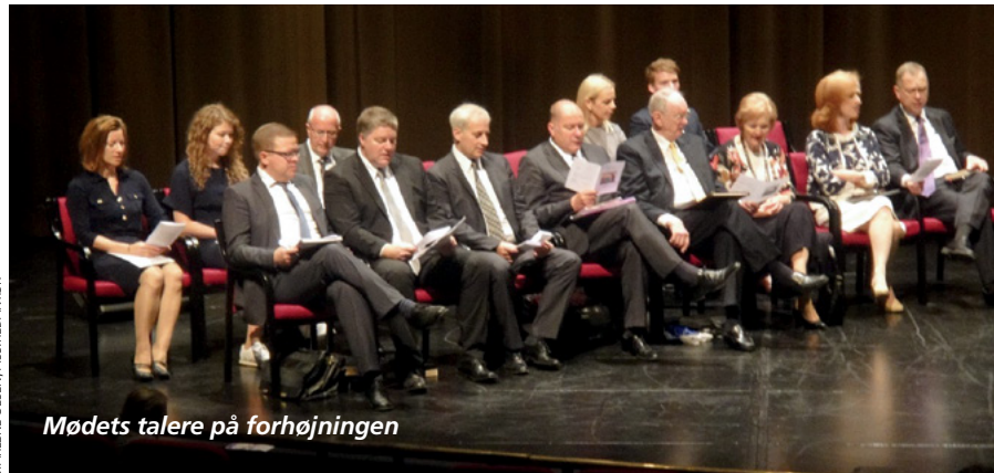
Mødets talere på forhøjningen

også nyde samværet med Frelseren, være stille og lytte til hans ånd.