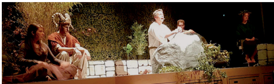
Kulminationen på Frelserens bøn

Efter omtrent et års forberedelser, heraf de sidste 1½ måned særdeles intensivt, leverede såvel solister som kor og teknik 3 fremragende forestillinger.