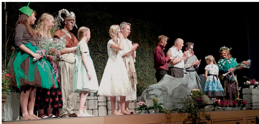
Forsamlingen og deltagerne hylkede instruktøren