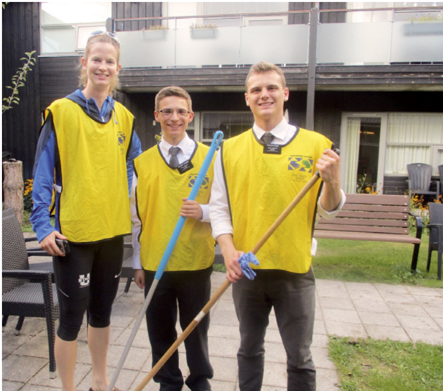
Nogle af de flittige arbejdere

forhallen, og andre missionærer og en ung kvinde spillede på guitar andre steder. Det gav en dejlig stemning, og flere beboere kom da også og satte sig.