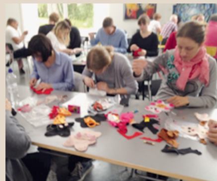
Nogle af de flittige deltagere

Det var skønt at knytte nye venskaber på tværs af så mange lande. ■