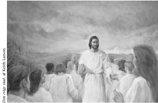
Den evige stad, af Keith Larson.

Dine elever står ofte over for verdens falske filosofier angående formålet med deres tilværelse. Når du underviser i frelsesplanen, bør du bidrage til at tydeliggøre formålet med livet på jorden og hvordan vor himmelske Faders plan giver vejledning og mening med livet. Når dine elever forstår frelsesplanen, vil de forstå, hvordan prøvelser, glæde, arbejde og opretholdelse af fysisk styrke spiller