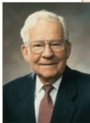
Ældste Marvin J. Ashton

»Jeg har tænkt over mange ting ved dette møde. Jeg er enig i det, som bror Ashton har sagt. Hvis jeg lige var blevet gift, ville jeg få fat i de 12 punkter, som bror Ashton har forklaret, og selv følge dem nøje og undervise mine børn og min familie og alle, som jeg kommer i kontakt med, i dem. De er grundlæggende. Lige fra jeg var barn, har jeg hørt Brødrene sige: »Skaf jer af med gæld og pådrag jer ikke gæld.« Jeg var i nogle år ansat i bankverdenen, og jeg så den forfærdelige situation, mange mennesker kom i, fordi de havde ignoreret dette vigtige råd.