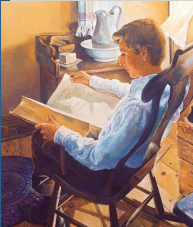
Da Joseph skulle beslutte sig for, hvilken kirke han skulle slutte sig til, søgte han vejledning i Bibelen. Der læste han: "... lad ham da bede Gud derom".

Fra den dag af arbejdede Joseph for Herrens sag med at oprette Jesu Kristi Kirke af Sidste Dages Hellige og med at opbygge Guds rige her på jorden i de sidste dage. Trofaste medlemmer af Kirken vidner om, at Jesus Kristus er verdens Frelser og Forløser. Jesus leder sin kirke i dag gennem åbenbaring til en profet på jorden. Joseph Smith var en sådan profet. Selvom Joseph udrettede meget i sit liv, var det vigtigste, hans forpligtelse til at være