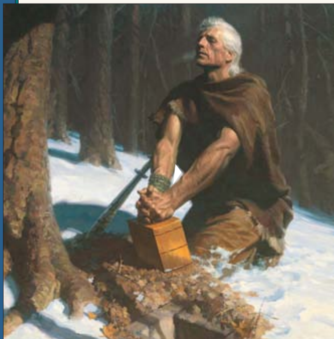
I år 421 e.Kr. begravede profeten Moroni sit folks hellige optegnelser i Cumora-højen. Da han senere vendte tilbage som en opstanden person, fortalte han Joseph om den gamle optegnelse, som indeholdt evangeliets fylde, således som Frelseren havde givet det til de tidligere indbyggere på det amerikanske kontinent. Denne optegnelse er Mormons Bog.

endvidere, at der var to sten, indfattet i sølvbuer – og disse sten, fastgjort til et brystskjold, udgjorde det, der kaldes Urim og Tummim – henlagt sammen med pladerne, og at besiddelsen og anvendelsen af disse sten var det, der karakteriserede »seere« i fordums eller tidligere tider, og at Gud havde beredt dem med det formål at oversætte bogen.