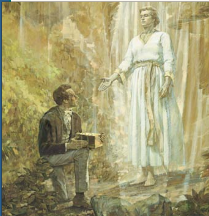
Moroni vendte tilbage en gang om året i fire år og instruerede yderligere den unge profet. Efter disse fire år modtog Joseph pladerne og begyndte at oversætte Mormons Bog.

Efter dette tredje besøg steg han igen op til himlen som før, og jeg var igen overladt til at tænke over det besynderlige ved det, jeg netop havde oplevet. Næsten straks efter at det himmelske sendebud var steget op fra mig for tredje gang, galede hanen, og jeg opdagede,