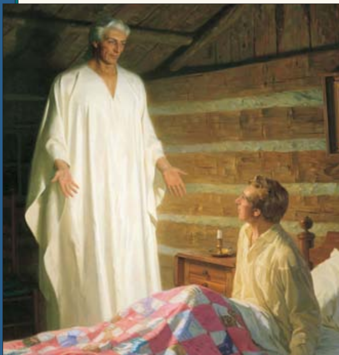
Tre år efter Joseph Smiths første syn sendte Gud englen Moroni for at instruere Joseph om gengivelsen af Jesu Kristi evangelium.

Forfølgelsen fortsatte, da Joseph nægtede at fornægte, at han havde set et syn. Den 21. september 1823 bad Joseph, efter at være gået i seng, for at vide, hvor han stod i Guds øjne. Englen Moroni viste sig for ham.