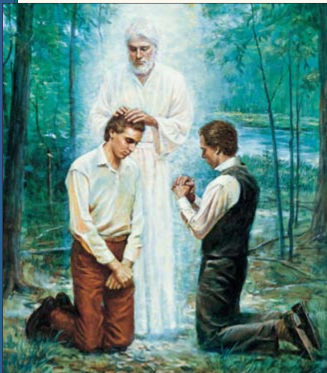
Den 15. maj 1829 modtog Joseph Smith og Oliver Cowdery Det Aronske Præstedømme ved håndspåleggelse af Johannes Døber.

V i var stadig beskæftiget med oversættelsesarbejdet, da vi en dag i den følgende