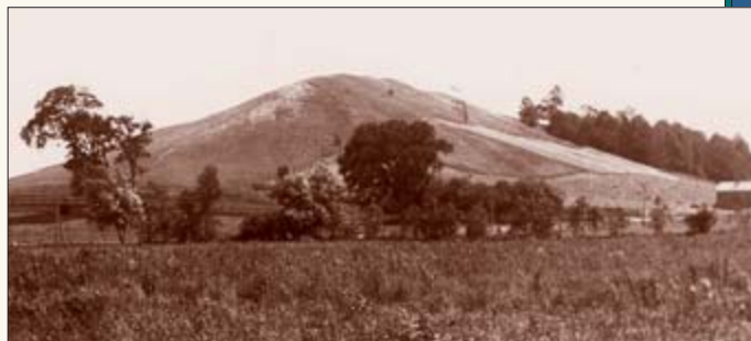
Cumorahøjen ligger cirka 5 kilometer sydøst for familien Smiths gård i Palmyra i New York. Josephs tid var nordsiden dækket af græs, på sydsiden var der spredte træer og småskov. Pladerne var begravet på sydvestsiden, ikke langt fra toppen. Foto: August 1907

Dette havde på det tidspunkt gjort så dybt et indtryk på mig, at søvnen havde forladt mig, og jeg lå overvældet af forbavselse over det, som jeg havde både set og hørt. Men hvor