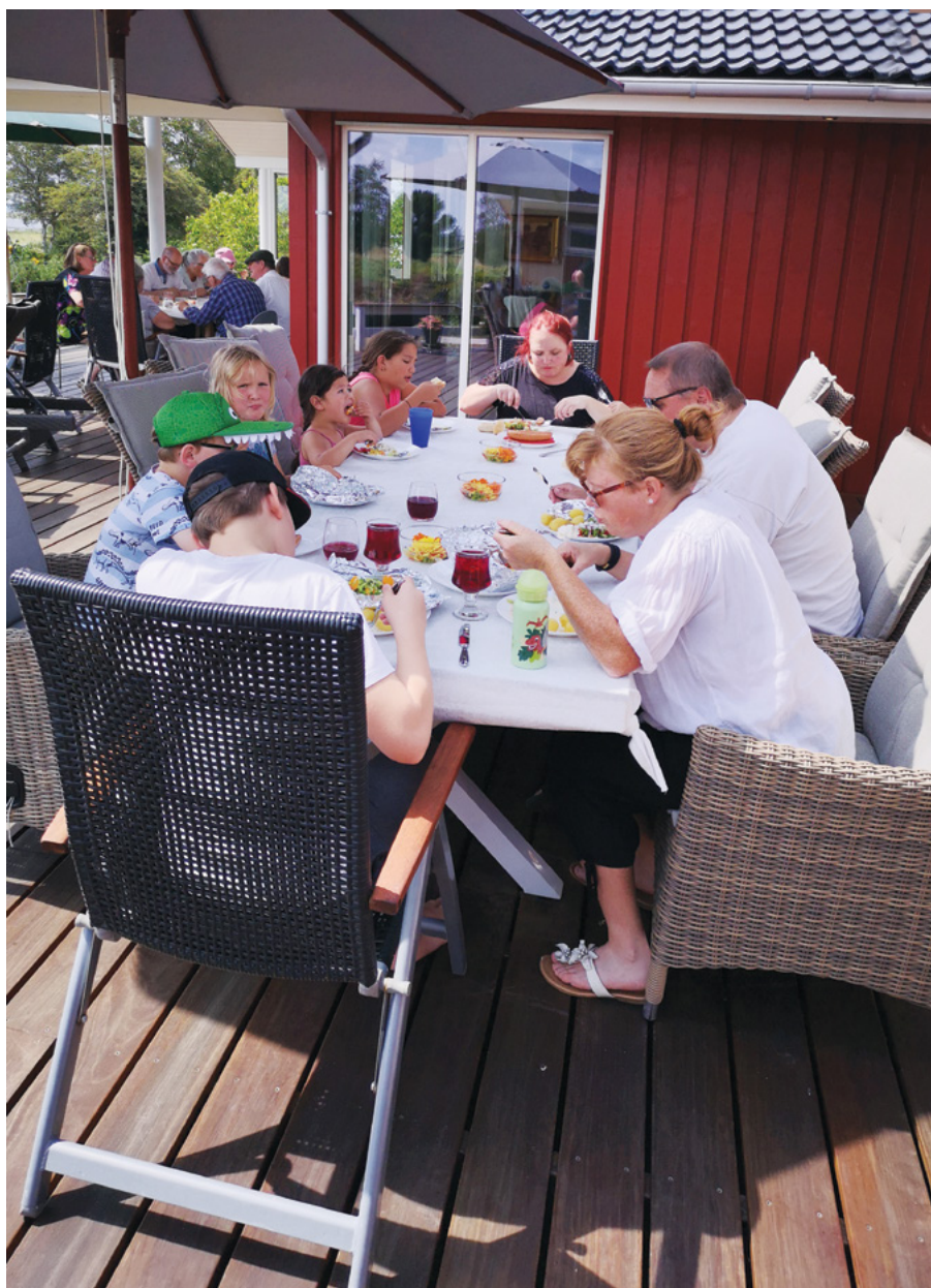
En del af de glade deltagere ved fiskefesten

Alt imens Hjælpeforeningen og kvorummet havde travlt med at arrangere oprettelsen af 2 nye koordineringsråd, meddelte biskoppen ganske uanfægtet, at det også var tid til en social aktivitet. Og han havde såmænd også et forslag. »Hvorfor inviterer vi ikke hele menigheden hjem til mig, så holder vi »skrubbefest« og jeg skal nok skaffe fiskene«. Det er vist, hvad man på engelsk ville kalde en »bold« udtalelse, men så snart en accept – uden besvær – var indhentet hos hans hustru, gik planlægningen i gang.