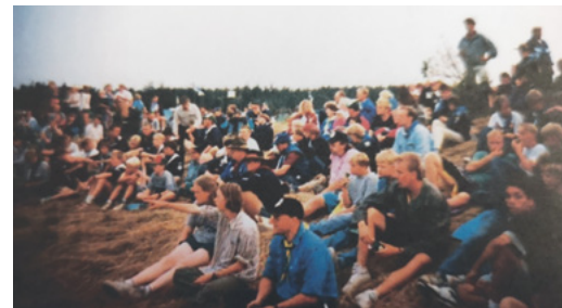
Et udsnit af deltagerne ved jamboreen i Danmark

Samtidig ophørte de skandinaviske jamboreer. Den sidste blev afholdt i