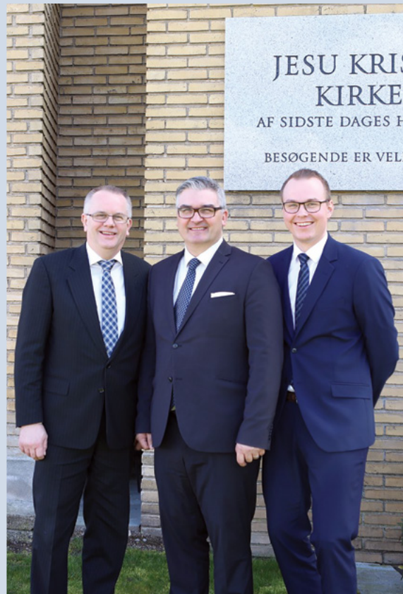
Det nye stavspræsidentskab for Københavns Stav