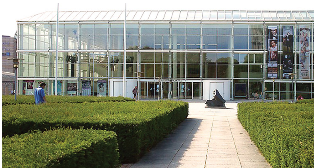
Århus Musikhus, hvor konferencen blev afholdt.

Han elsker at læse Frelserens bønner. I 3 Nefi var Kristi bøn så hellig, at den ikke måtte skrives ned, og de var overvældet af Ånden. Vi lærer, at bønnens kraft er stor. Det er en kraft, der fylder os. Herren velsignede dem, mens de bad. Der sker forandringer med os, når vi holder os tæt til vor himmelske Fader. Vi kan opleve helliggørelse, når vi beder. Lad os arbejde på at udvikle kristuslignende karakterer, bede og være nær ham.