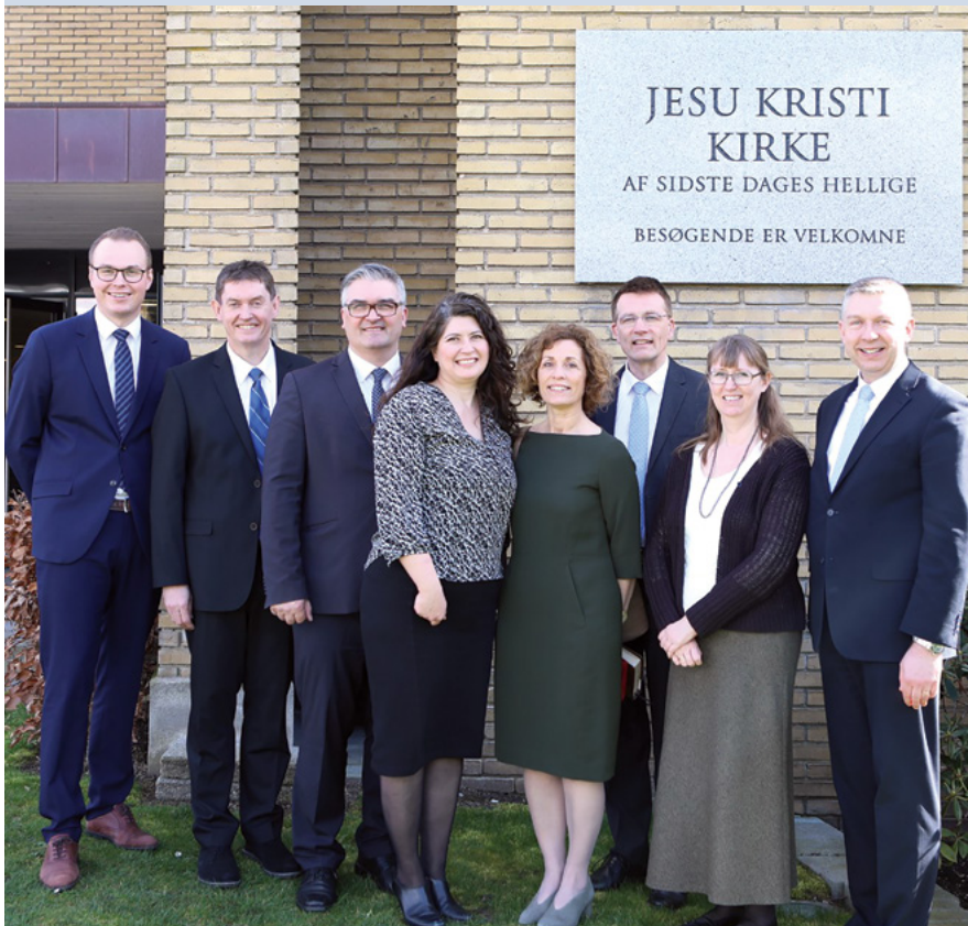
Nogle af talerne ved søndagens møde