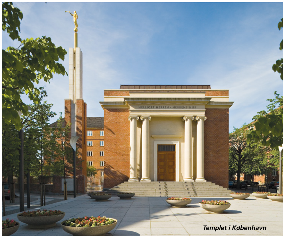
Templet i København