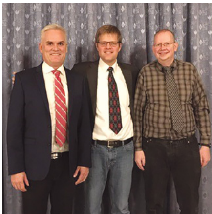
Det nye grenspræsidentskab i Midtjylland Gren