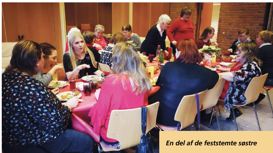
En del af de feststemte søstre