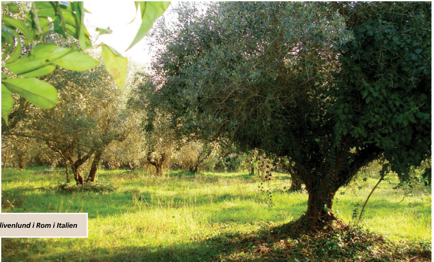
Olivenlund i Rom i Italien

igen for sidste gang. 5 I løbet af vores samtale bad jeg disse unge missionærer om med et ord at beskrive, hvad denne kombinerede indsats med at indsamle Israel, hvor missionærer og medlemmer arbejder sammen, er. Disse ord omfattede udtryk som kærlighed, venlighed, venskab, tillid, forståelse, accept, glæde og lykke.