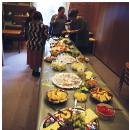
Det bugnende julebord