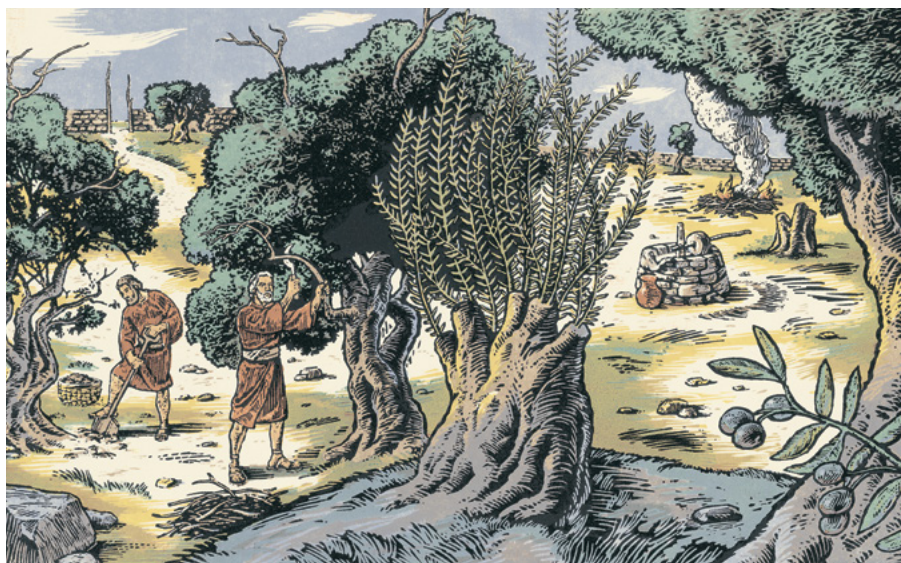
Allegorien om oliventræet

I vers 52 til 68 forklarer vingårdens Herre det arbejde, der vil være en del af at indsamle og pøde oliventræets grene. Han kalder på tjenerne til at »grav[e] ... rundt om dem, og beskær dem, og gød dem igen .... så alle må blive passet