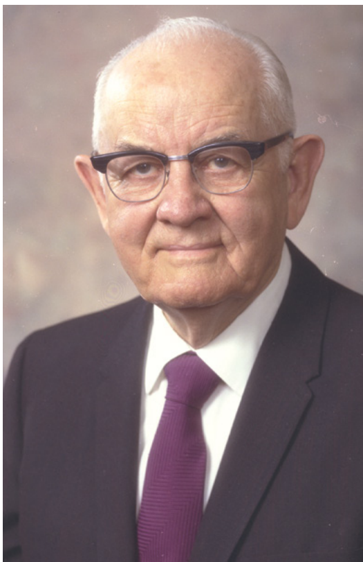
Præsident Spencer W. Kimball

til resten af måneden. Det ville blive næsten en hel måned uden penge.