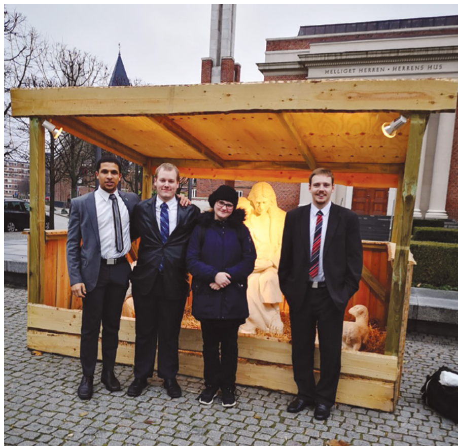
Den lille gruppe foran krybben

Vores sidste tur i 2018 var planlagt til lørdag den 1. december, og tilmeldingerne så meget fine ud. Så drog vi til templet med en forventning om 5-6 dåbskandidater, deriblandt en nydøbt