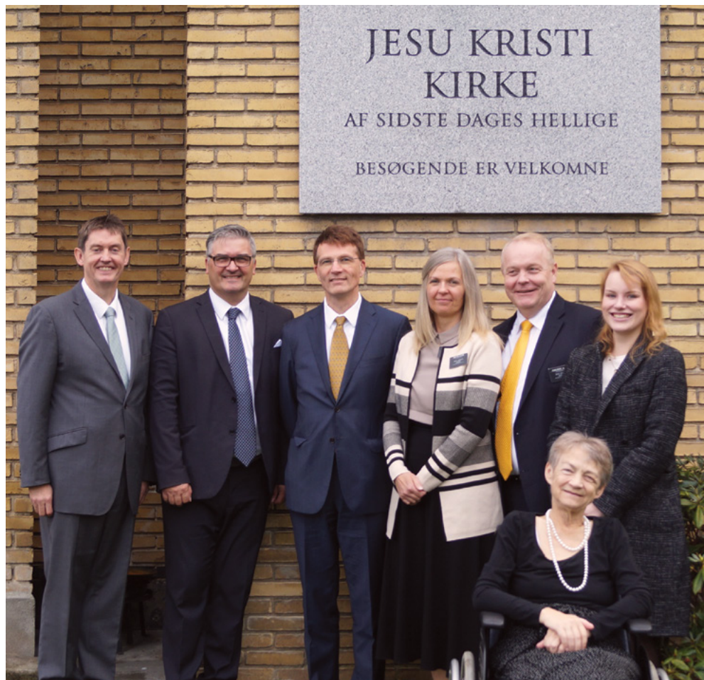
Talerne fra søndagens møde

Begyndelsen blev ikke ringere af, at stavspræsidentskabet endnu engang havde valgt at »invitere« såvel deltagerne i lederskabsmødet som til aftenmøde til spisning i pausen mellem de to møder. Fremragende ide.