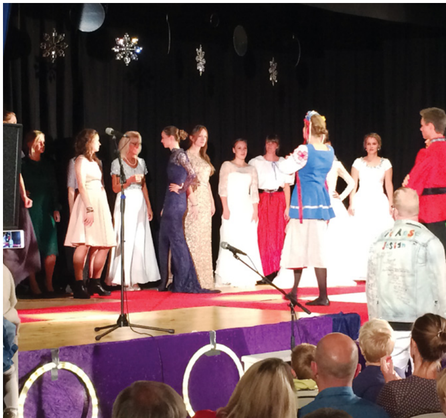
Nogle af manequinerne, der fremvise kreationer

Tak til alle jer, som havde planlagt dagen, taler, musik, aktiviteter, mad og alt andet praktisk. ■