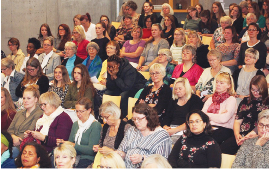
Et udsnit af de mange dejlige søstre, der deltog