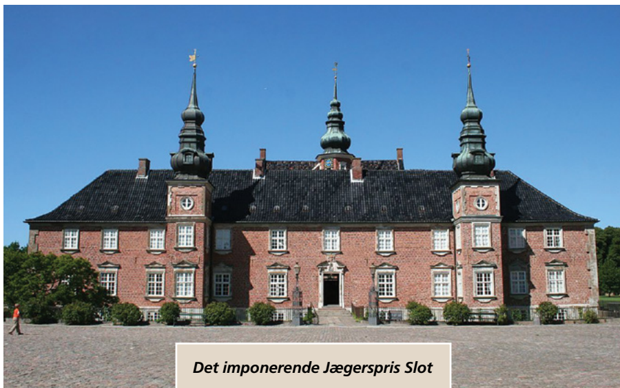
Det imponerende Jægerspris Slot

dårligt stillede piger ved at give dem et hjem samt plads til at opdrage og uddanne dem.