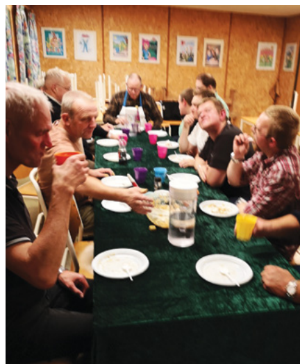
Deltagerne samlet omkring bordet.

Så spørgsmålet denne gang: Hvor skal vi tage hen?