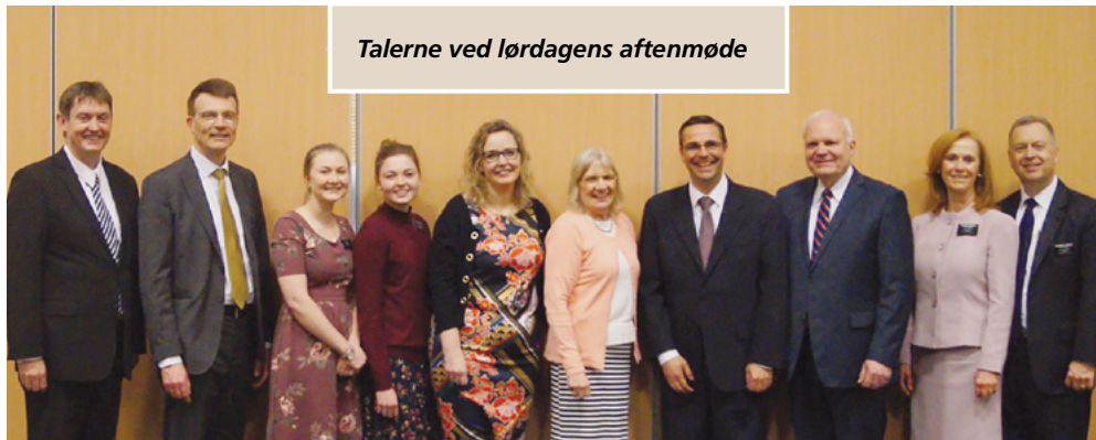
Talerne ved lørdagens aftenmøde

Vi skal ændre os gennem omvendelse og formes af Gud, og det kan være en pinefuld proces. Kristus er den eneste, der har levet et fuldkomment liv, og kun i og gennem ham kan vi blive fuldkomne. Kristus og ikke forsoningen frelser