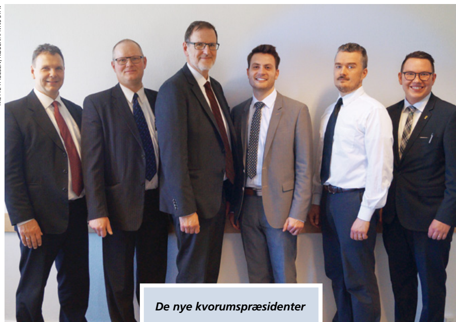
De nye kvorumspræsidenter

Liahona ønsker alle til lykke – en spændende dag. ■