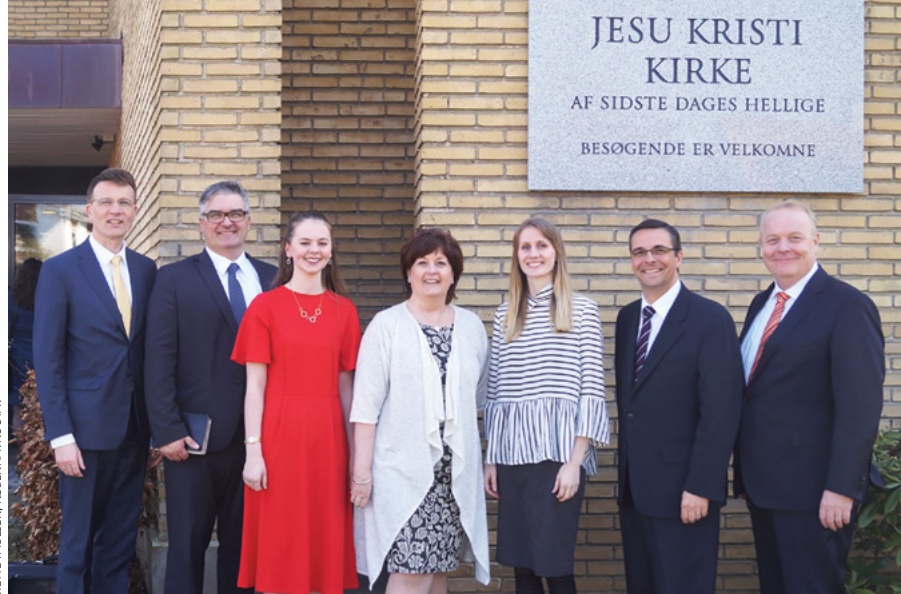
Talerne ved konferencens hovedmøde