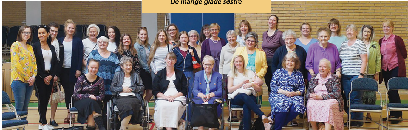
De mange glade søstre