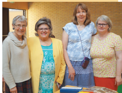
De fire »oprindelige« søstre