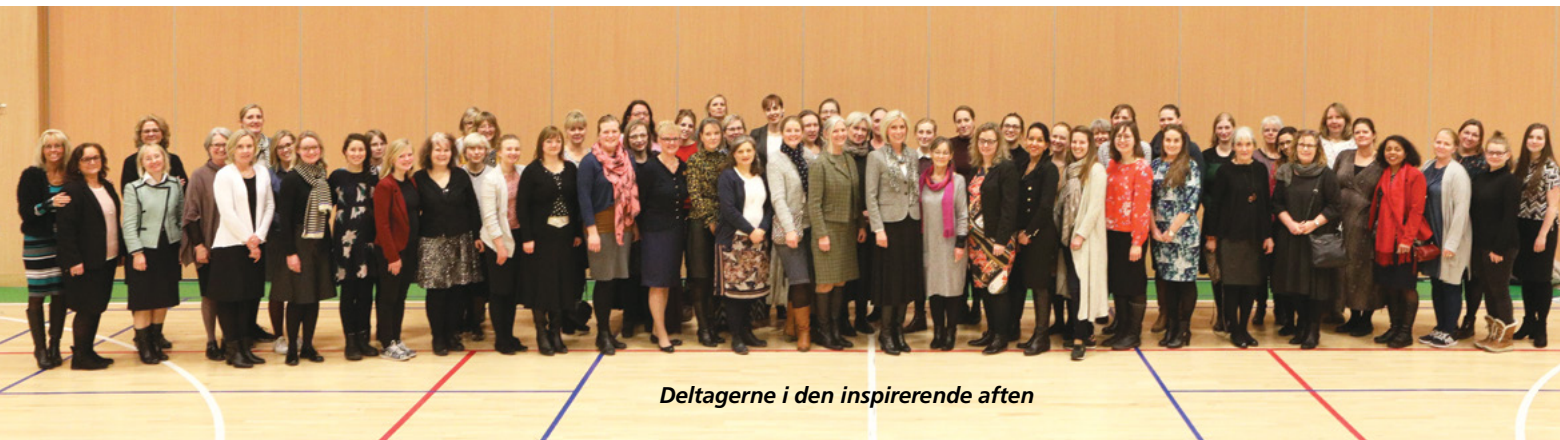
Deltagerne i den inspirerende aften

Det var en inspirerende og opbyggende aften, hvor vi alle kunne tage noget med hjem. ■