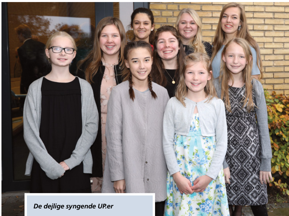
De dejlige syngende UP'er

vidnesbyrd gennem oplevelser på sin mission og om, hvordan evangeliet bringer ro i tilværelsen. Det er gennem Kristi evangelium, der er såvel sandt som fantastisk, at vi kan opnå den største og bedste glæde.