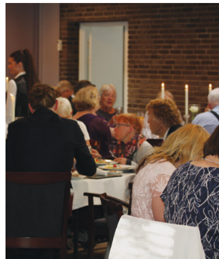
Der blev hygget og spist med stor fornøjelse

over at være til stede her blandt alle disse dejlige søskende, den ene mere festklædt end den anden, taknemlig over at være en del af fællesskabet her i Aarhus Stav.