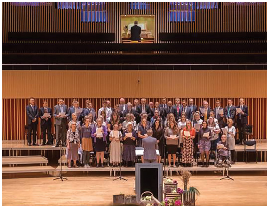
Det skønne konferencekor