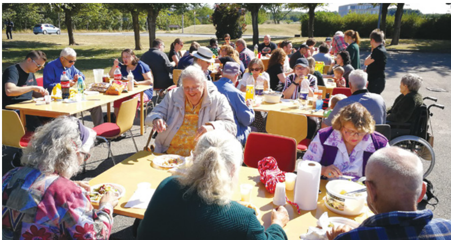
De mange gæster nød maden, vejret, samværet m.m.