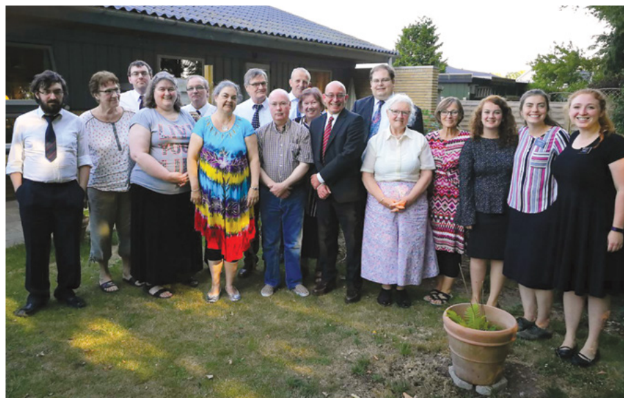
De glade deltagere samlet i haven.

Baggrunden for ønsket var, at hun og nogle andre medlemmer, der var nydøbte, boede langt fra kirken – nogle i Næstved og hun selv i Mogenstrup – og rejsen til Slagelse med offentlige transportmidler var både dyr og tidskrævende, ligesom helbredet heller ikke ligefrem tilskyndede til sådanne udflugter.