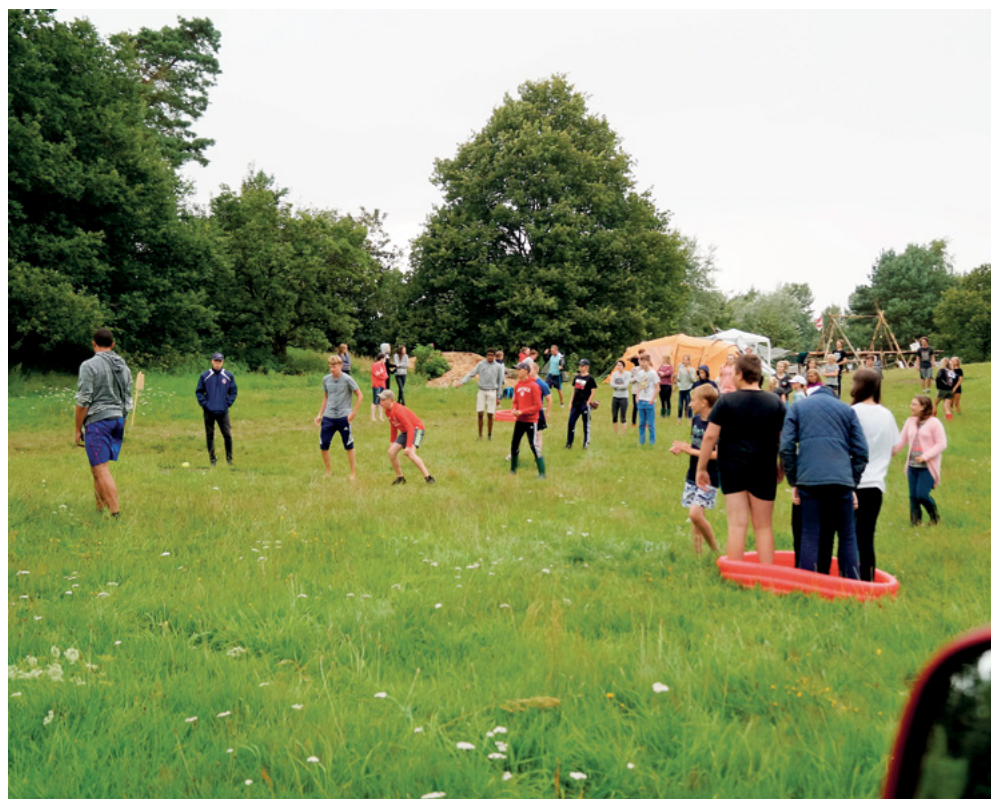
Så spilles der rundbold med badekar

Og vi glæder os allerede til næste år. ■