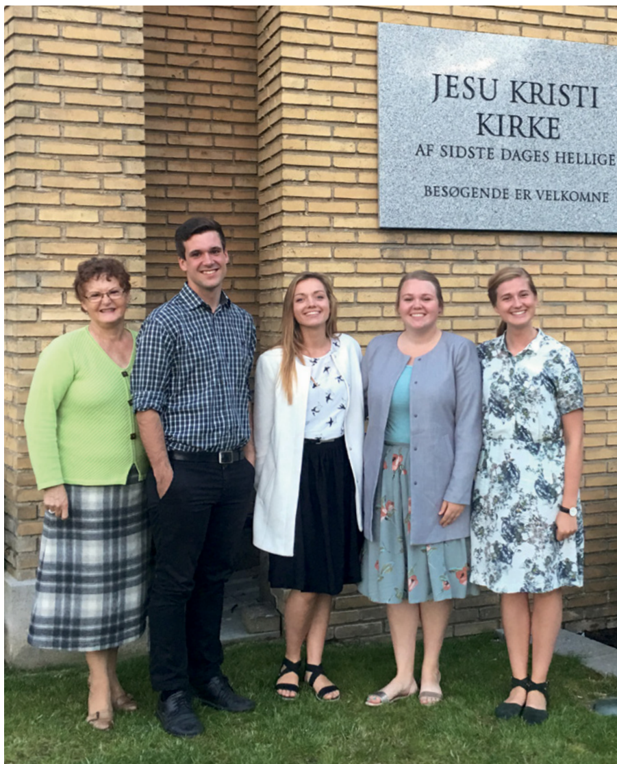
De fem hjemvendte

Når man har kendt de pågældende i en årrække, er det så åbenlyst at erkende og samtidig nyde, den forskel og vækst en mission medfører.