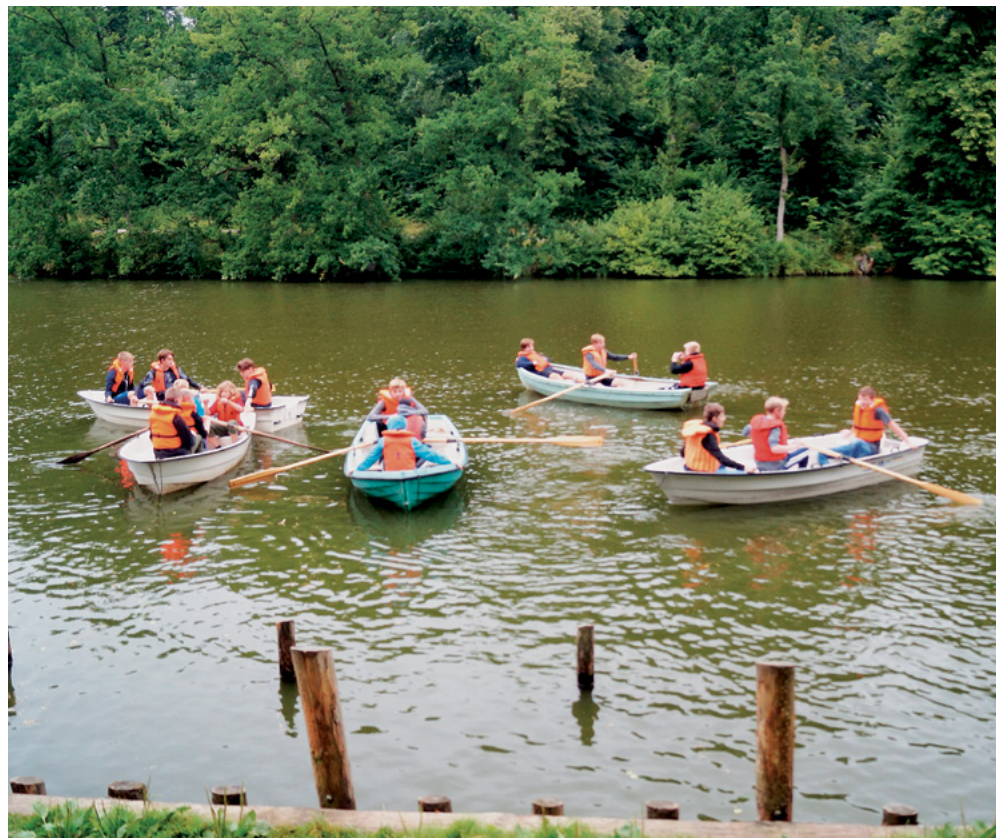
Støt står den danske sømand?

Denne overskrift dækker over såvel onsdagens som torsdagens »main event«. Om onsdagen fik alle de drenge, der ønskede det, mulighed for at komme ud at sejle, idet man havde lejet Morud Lystfiskerforenings 6 robåde beliggende ved Langesø, Desværre var der ikke lagt op til at fiske, for Langesø er særdeles kendt som et godt fiskested, men det ville så have krævet fisketegn. Næ, i stedet blev drengene inddelt i hold af 18, der forskudt gik de ca. 3 km ned til søen, hvorefter de i grupper af 3 kunne få en times sejlads på søen. Redningsveste var til stede, selvom en del af dem var særdeles små. Herren var med os, så på trods af visse tåbeligheder under sejladsen slap alle helskindet fra oplevelsen – men dog ikke »tørskindet«. Den sidste gruppes maritime eventyr ledte tanken hen på Noa, selvom de ikke sejlede i 40 dage med kun ca. 50 minutter. Ikke længe efter de 5 stolte fartøjer (der var ikke nok til 6 både) var stævnet ud fra broen, blev der åbnet for sluserne. Det var så voldsomt, at et par stykker, der ikke havde fundet nødvendigt med en