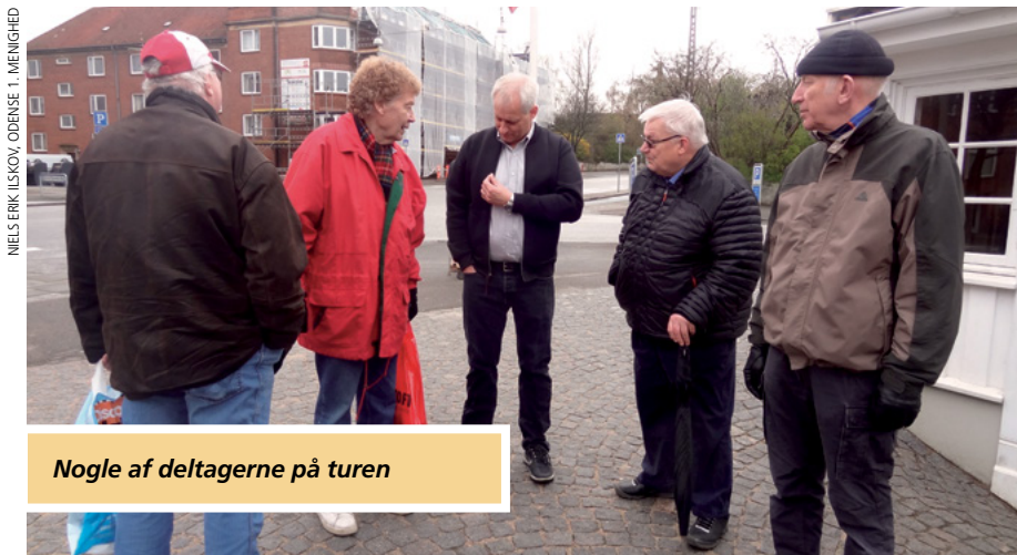
Nogle af deltagerne på turen