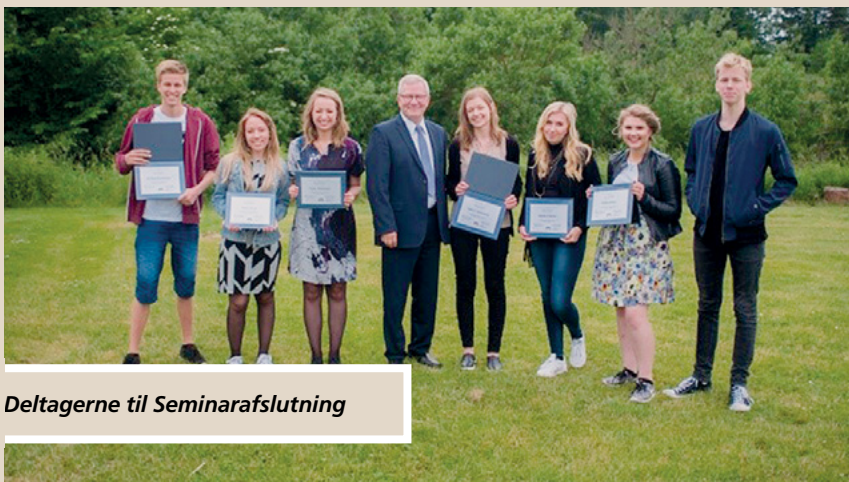
Deltagerne til Seminarafslutning