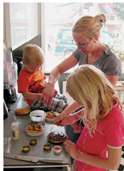
ØRTEGREN, FREDERIKSHAVN GREN