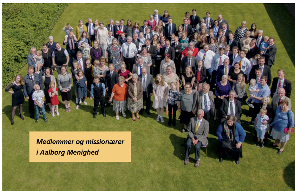
Medlemmer og missionærer i Aalborg Menighed

Endnu en fantastisk konference hvor vi alle fik fyldt olie på vores lamper. ■