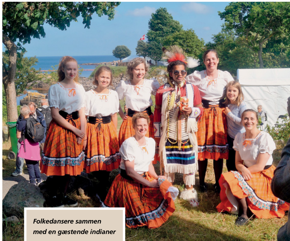
Folkedansere sammen med en gæstende indianer