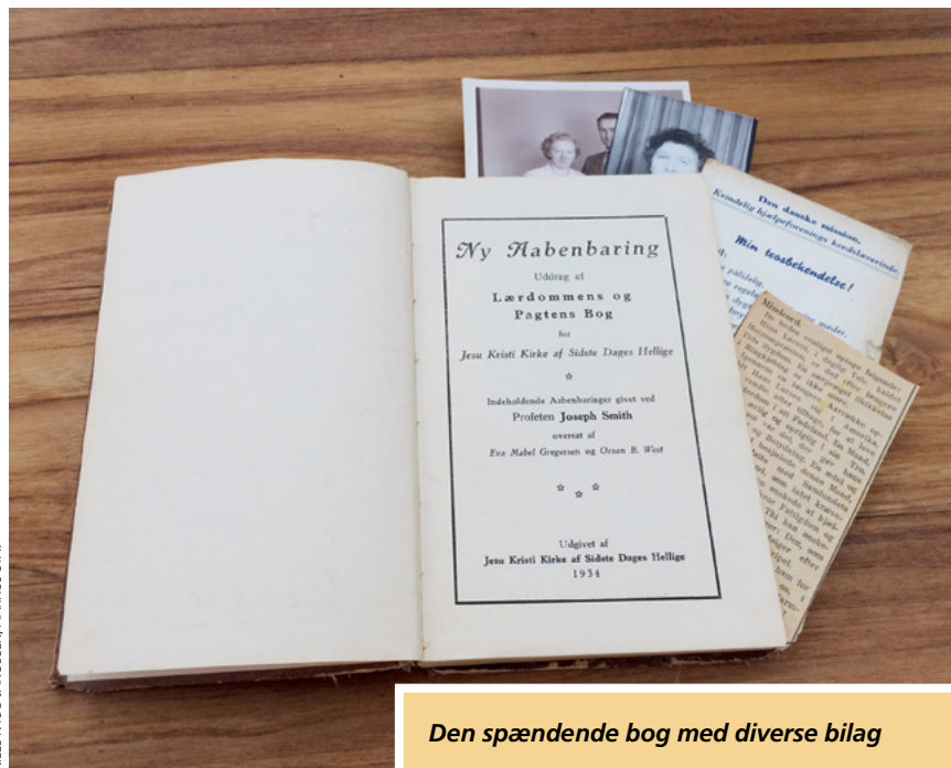
Den spændende bog med diverse bilag