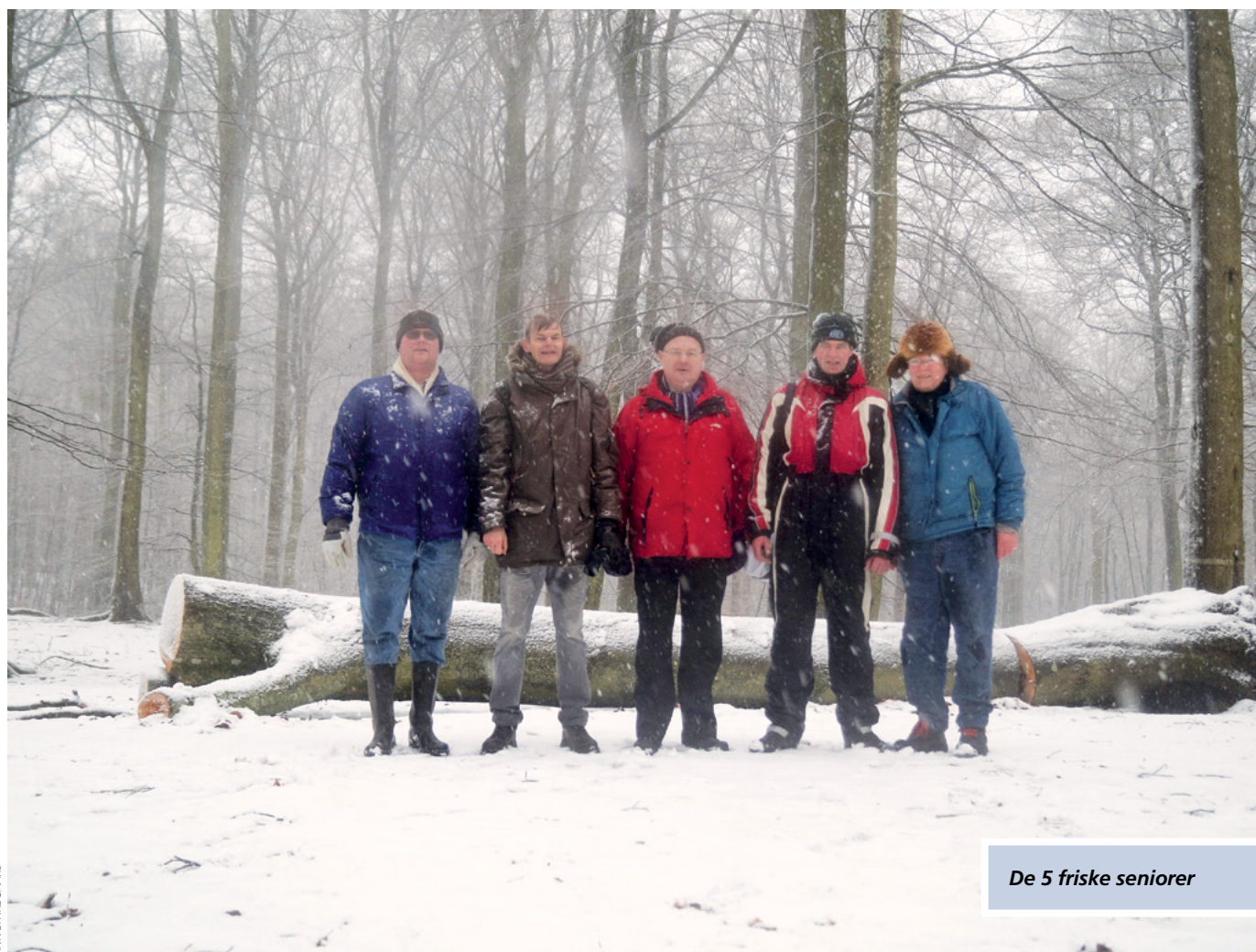
De 5 friske seniorer

Således opfyldt med åndelig bagage fik vi efter morgenmaden