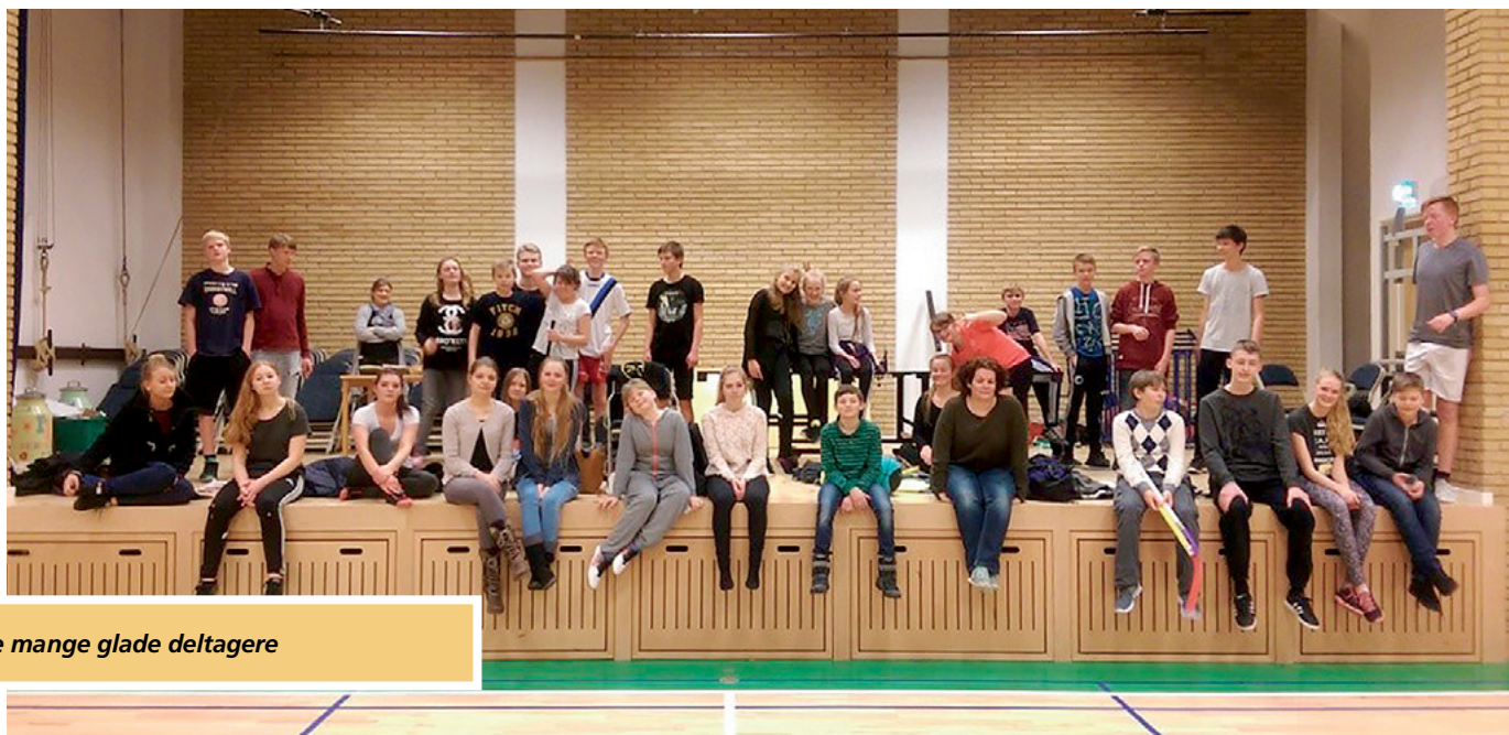
De mange glade deltagere