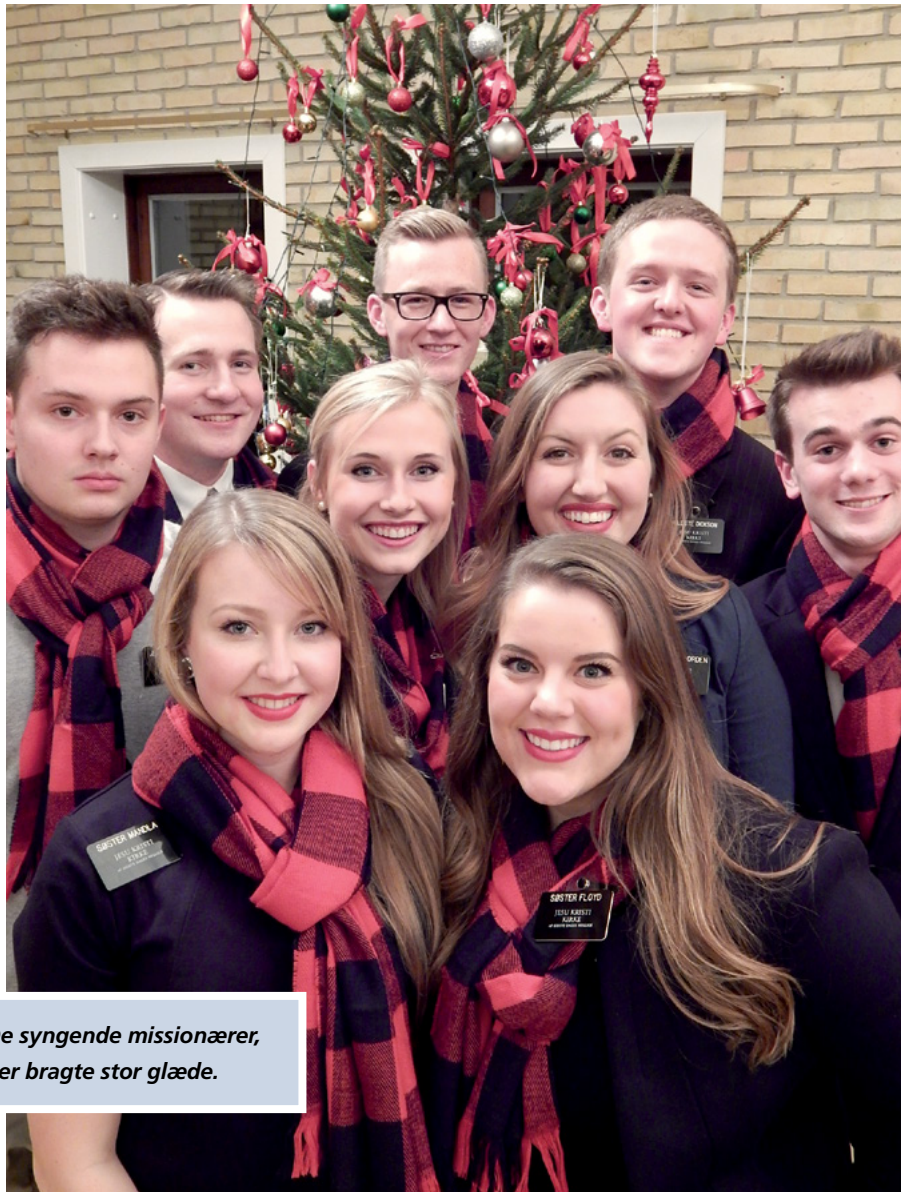
De syngende missionærer, der bragte stor glæde.

missionærer alle, som var til stede både med det sjove og det åndelige.