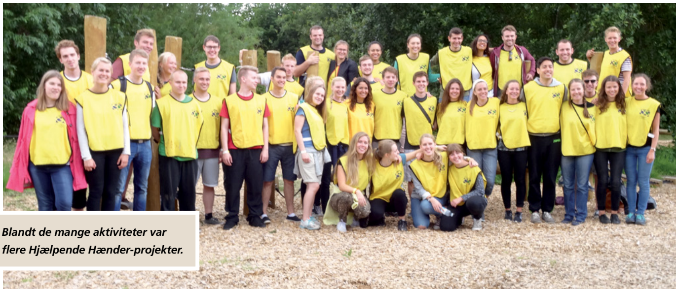
Blandt de mange aktiviteter var flere Hjælpende Hænder-projekter.