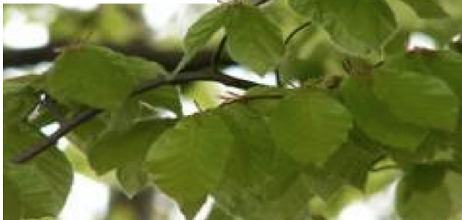
Bladene med de smukke farver

Giv aldrig op. Bliv ved med at tro, selv om det ser håbløst ud, for Gud er alting muligt, og alt sker efter hans vilje, på hans måde og til hans tid. ■