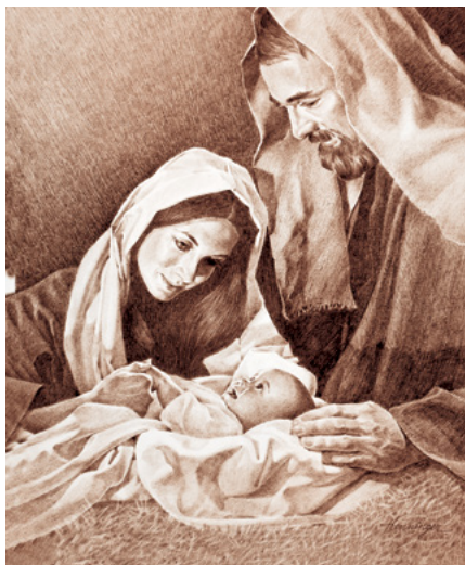
ILLUSTRATION: TED HENNINGER