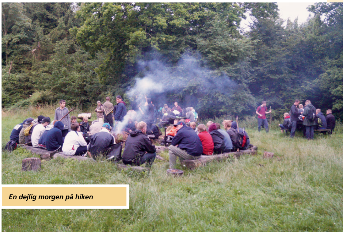
En dejlig morgen på hiken

hjemme fra. Og atter i år var det skønt at gense såvel ledere og drenge, man havde mødt på tidligere lejre som at se en del nye ansigter – især de 12 årige, der var med for første gang.