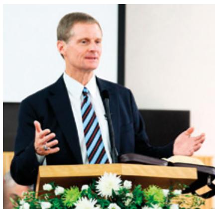
Elder David A. Bednar

Elder Bednar har givet os seks vejledninger i brugen af sociale medier: