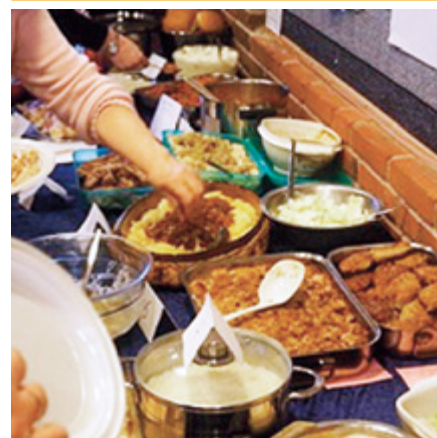
Der var kø ved de herlige retter

Et kæmpe antal muffins blev anrettet på et par borde i »spisesalen«, og flormelis og andre pyn-tegenstande i mange farver blev sat frem. De fremmødte børn blev bænket om kagebordet, og med tungen lige i munden gik de alvorsfulde i gang med det dekorative arbejde.