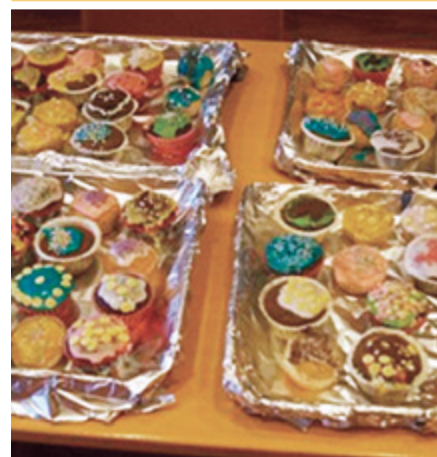
De fantastiske muffins