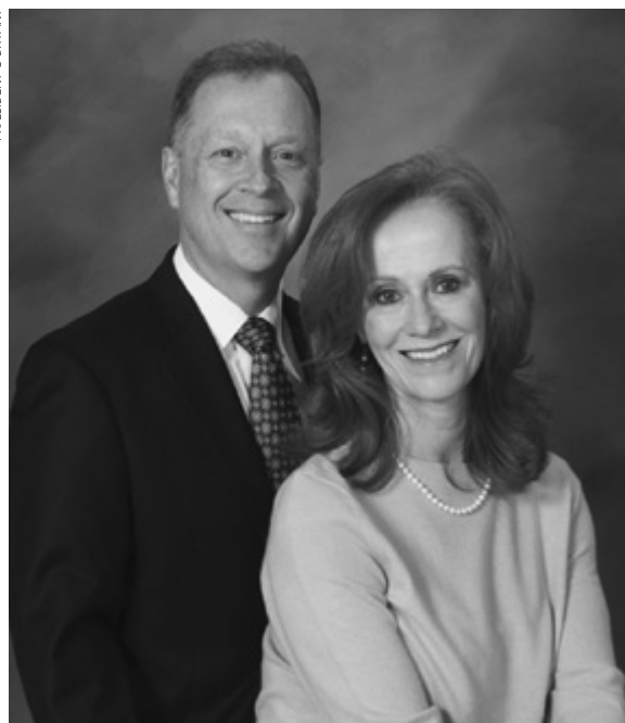
Præsident og søster O'Bryant