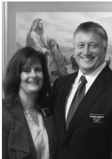
Præsident og søster Sederholm

disciples mission) vokset siden den første oplevelse. Vi er blevet undervist og elsket af jer. I har hjulpet os til at være og arbejde bedre. Vi er også blevet undervist og vejledt af Frelseren selv i hans lærdomme og i, hvordan vi mere helt efterlever dem. Vores tro på ham og hans forsoning har øget vores ønske om og evne til at omvende os mere helt ud på daglig og ugentlig basis. Vores ønske om at følge ham i ord og gerning har tilladt os at forny vore hellige pagter med Gud hver uge i hans navn. Vi har regelmæssigt deltaget i de frelsende ordinancer sammen med mange af jer, og det har medført en udgydelse af Helligånden i løbet af disse tre år. Vi har været