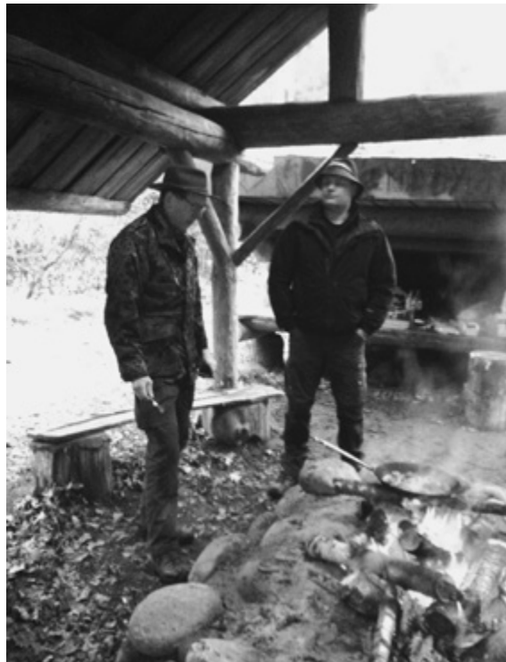
Et par af de vågne brødre ved morgenmadstilberedningen