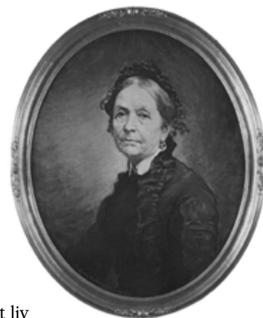
KOPI FRA HISTORY OF RELIEF SOCIETY