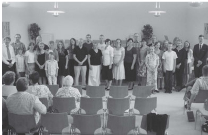
Sang- og musikfestivalens talentfulde deltagere.