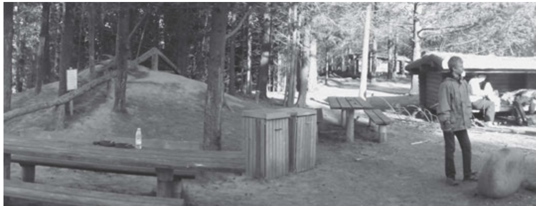
JØRN HOLM BENDTSEN

Efter at have tilbagelagt 15 km, var det tid til at slå lejr.