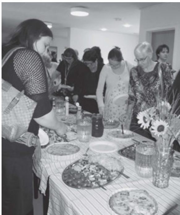
Efter de 2 klasser var der tilberedt et dejligt måltid mad.

Efter at vi var blevet samlet til afslutning, hvor vi sang »Jeg er Guds kære barn«, nød vi det lækre måltid, som søstrene i Aalborg Menighed havde forberedt til os. Der var tid til at fordøje de timer, der var gået forud, pleje søsterfællesskabet og gøre sig klar til at vende hjemad. En søster udtalte: »Nu vil jeg gå hjem og gøre noget ved det ...« og hvilken bedre afslutning kunne man tænke sig, end ønsket om positiv forandring på baggrund af dagens arrangement? ■