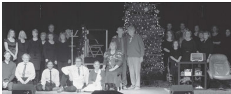
Frivillige fra København Stav fremførte jule-musicalen »The Forgotten Carols«.

Det har været spændende at se og høre, hvordan det