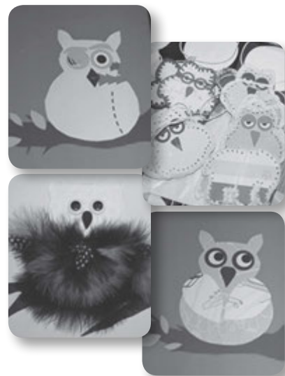
Der blev klippet og klistret, og så lærte pigerne ikke mindst at hækle. Det blev til en del billeder, samt ophæng til vinduer og en uro.