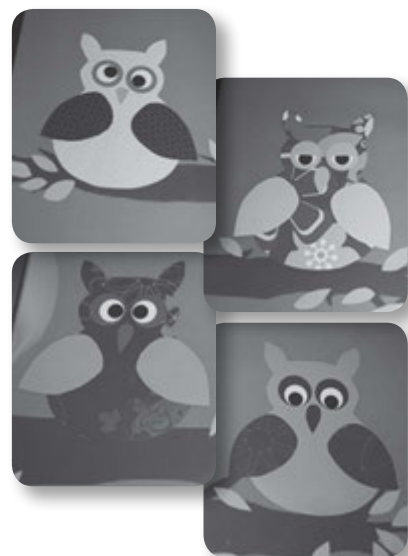
Her ses nogle af pigernes flotte billeder.

Vi har en gruppe unge piger i Aalborg Menighed, som er humoristiske, sprudlende, opofrende, hjælpsomme, overbærende, kærlige og ikke mindst tjenstvillige. De modtager en udfordring med sindsro, mod og vilje. Det gjorde de også, da de modtog udfordringen om at være med i et tjenesteprojekt. At gøre noget for andre er en god og sund læreproces. Det er i Kristi ånd, og vi ønskede at pigerne skulle mærke velsignelserne derved på egen krop.