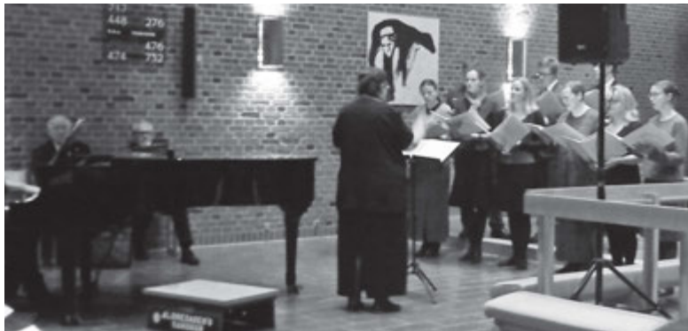
Her synger Frederikshavn Grens kor til koncerten i Abildgårdskirken