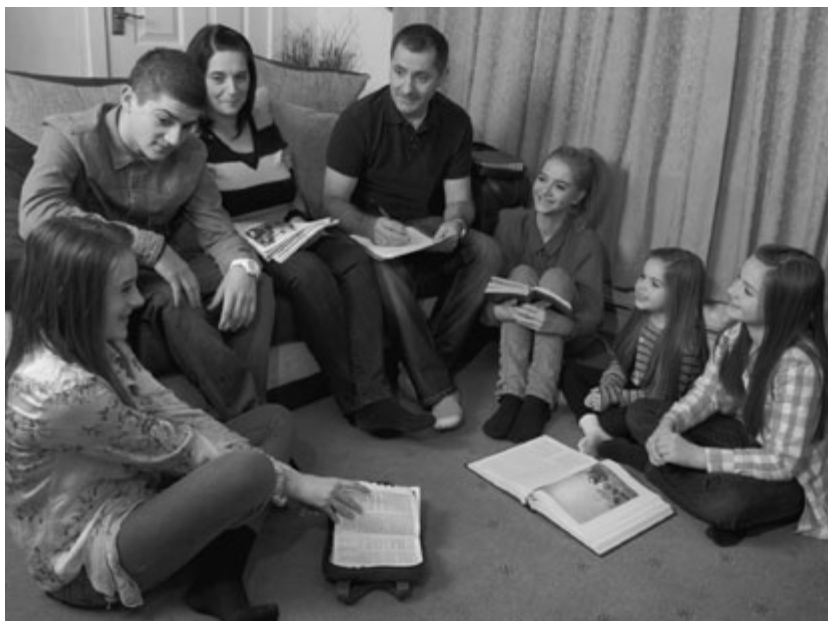
Familien Mayall til familieaften

Derpå inviterede vi vore fuldtidsmissionærer, både ældster og søstre, hjem til os. Vi talte sammen om budskabet og viste dem vores liste, så de kunne bede sammen med os om, at vi måtte få succes i vores indsats.