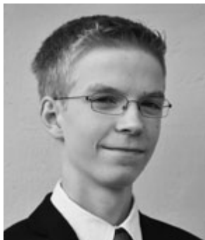
Christian 17 år fra Gladsaxe 1. Menighed

»Derfor må I trænge jer frem med standhaftighed i Kristus og have et fuldkommen klart håb og en kærlighed til Gud og til alle mennesker. For se, hvis I trænger jer frem, idet I tager for jer af Kristi ord og holder ud til enden, se, så siger Faderen: I skal få evigt liv« (2 Ne 31:20).