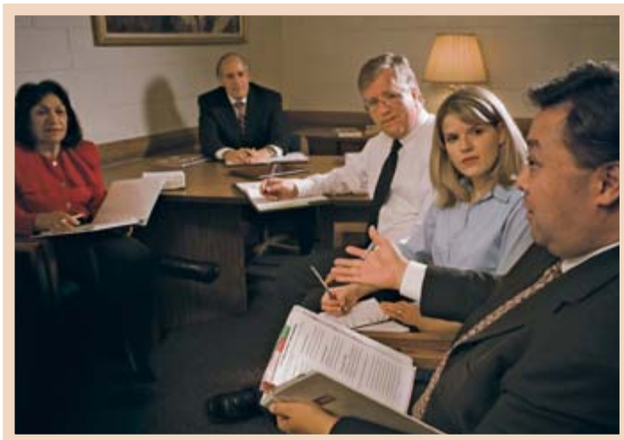
Under biskoppens ledelse hjælper menighedsrådet med at løse velfærdsbehov.

præstedømmets udøvende komitémøde, hvor præsidentskabet for Hjælpeforeningen er inviteret til at deltage.