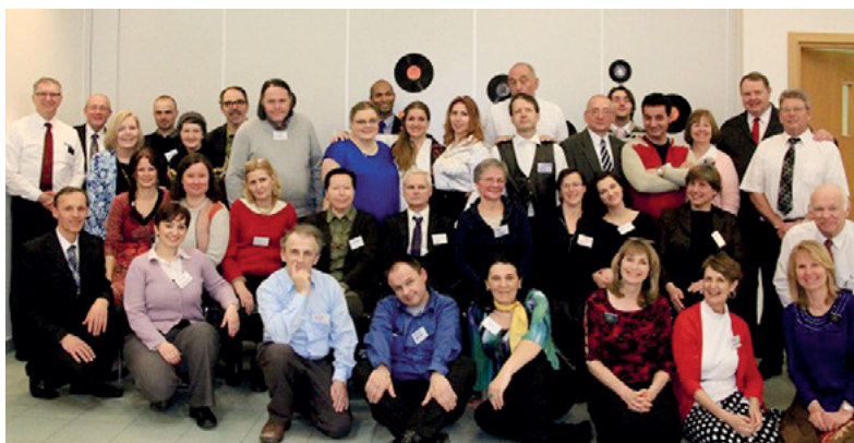
Grupna slika sa sabora za samce u ožujku

je održan 4. i 5. ožujka, a drugi 23. i 24. rujna 2016. godine. Sabori su pokazali našu spremnost na služenje i na trajno učenje i jačanje vjere. Tema prvog susreta bila je »Zajedno smo