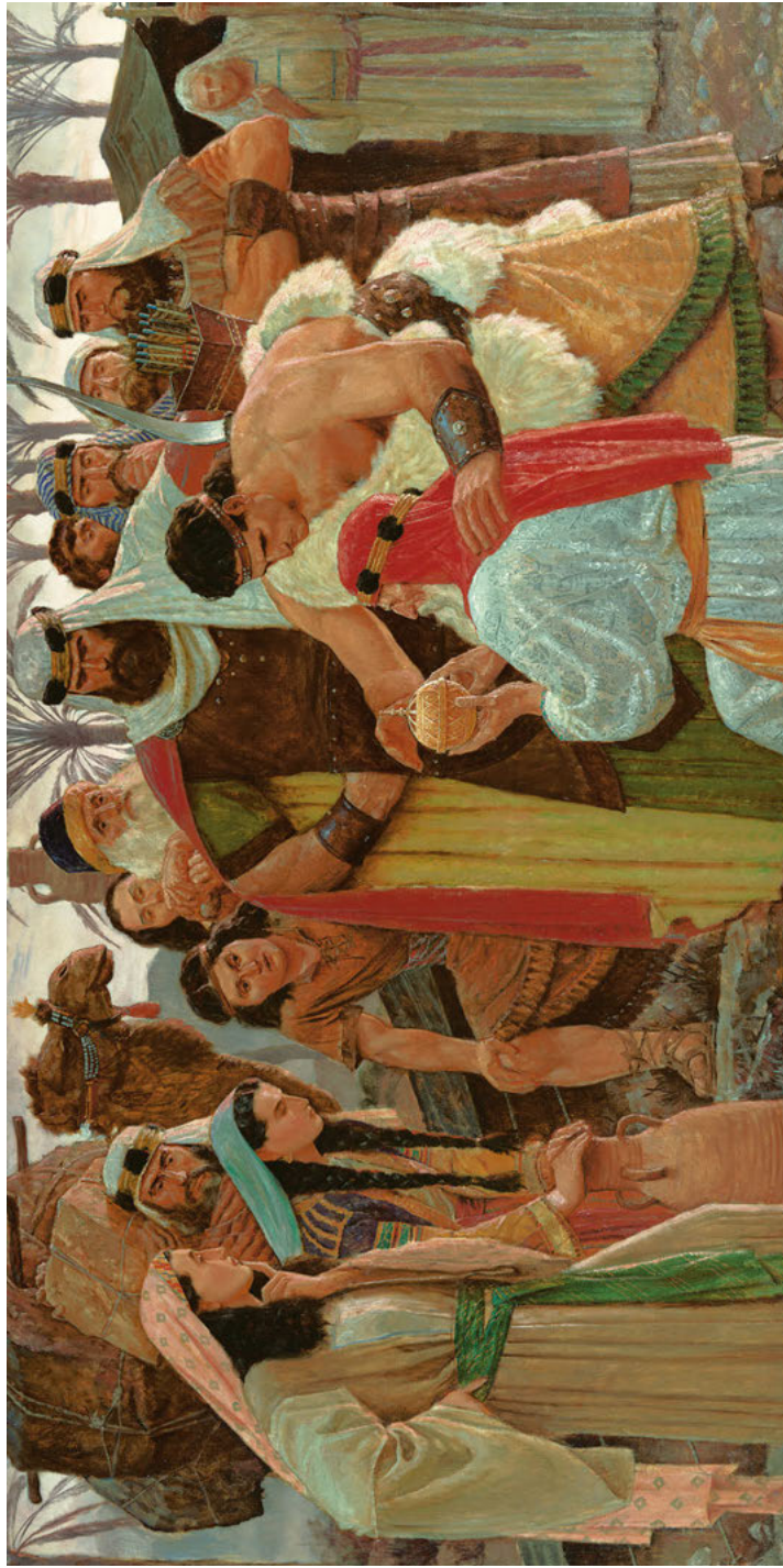
Lehi otkriva Lijahonu Naslikao Arnold Friberg Vidi 1 Nefi 16, str. 34–38